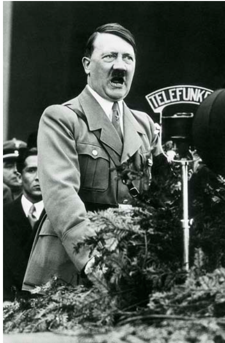
1. El setantè aniversari del suïcidi del gran orador que fou Adolf Hitler no passarà despercebut. 2. Última imatge coneguda de Hitler, el 20 d'abril de 1945, pocs dies abans del seu suïcidi. 3. L'exèrcit roig va reduir a ruïnes tot el centre de Berlín amb la intenció de no deixar res que recordés el nazisme.

Llegenda. Els invasors es torbaren 48 hores a prendre tota la zona de la cancelleria del Reich i, per tant, també el búnquer. Va ser un destacament especial del servei secret de Stalin, que havia arribat a Berlín el mateix dia del suïcidi amb la missió de localitzar i fer-se càrrec viu o mort de Hitler, el que s'encarregà de rebre la rendició dels