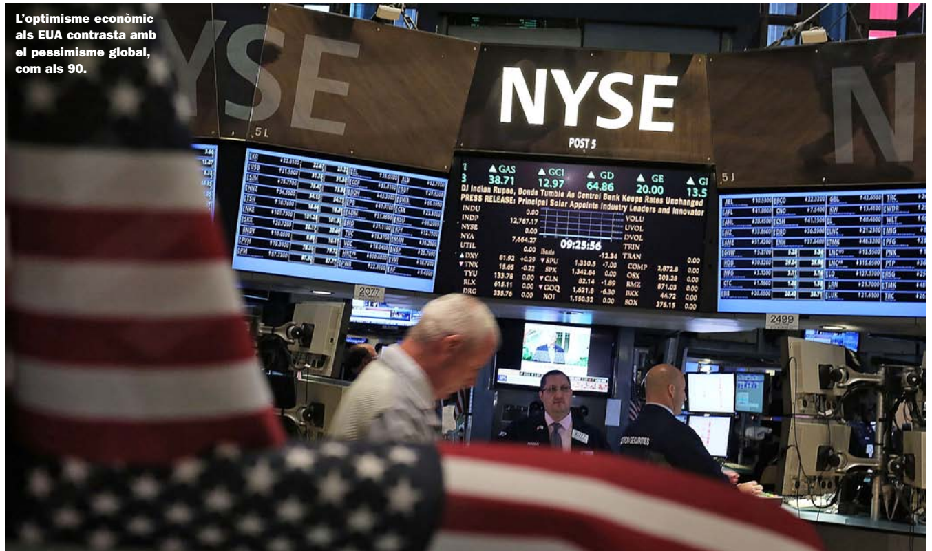
L'optimisme econòmic als EUA contrasta amb el pessimisme global, com als 90.

El 2015 l'economia mundial mantindrà els ecos alarmants de la darrera dels anys 90.