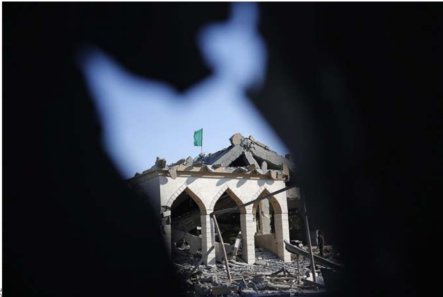
La franja de Gaza és la zona més castigada per l'enfrontament atàvic entre àrabs i jueus. A la foto, una mesquita bombardejada.

clat de la violència massiva. Fins aleshores s'havien produït atacs aïllats entre una comunitat i una altra des del XIX i durant les dues primeres dècades del XX. Però així com avançaven els anys