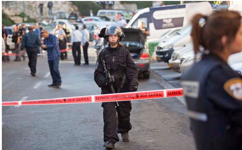
La violència a Terra Santa és el “pa nostre de cada dia” entre els atacs terroristes palestins a Israel i la resposta violenta de l'Estat jueu contra els enclavaments palestins.