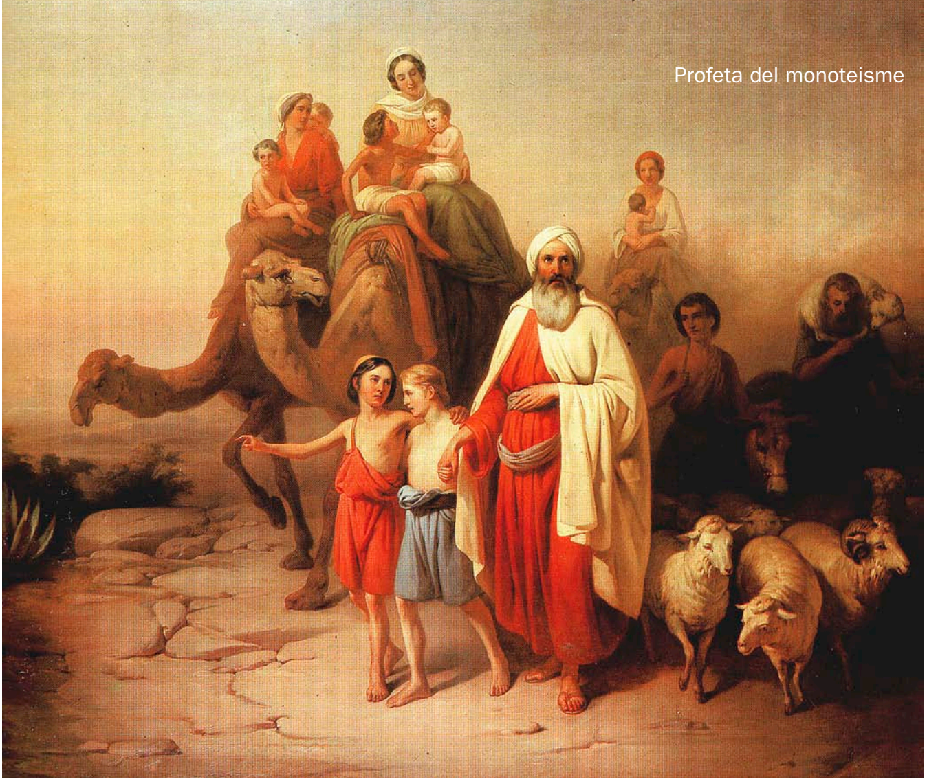
Abraham, la seva esposa i els seus esclaus foren nòmades, segons el mite explicat en el Gènesi. Ell és considerat el pare del judaisme, el cristianisme i l'islamisme.