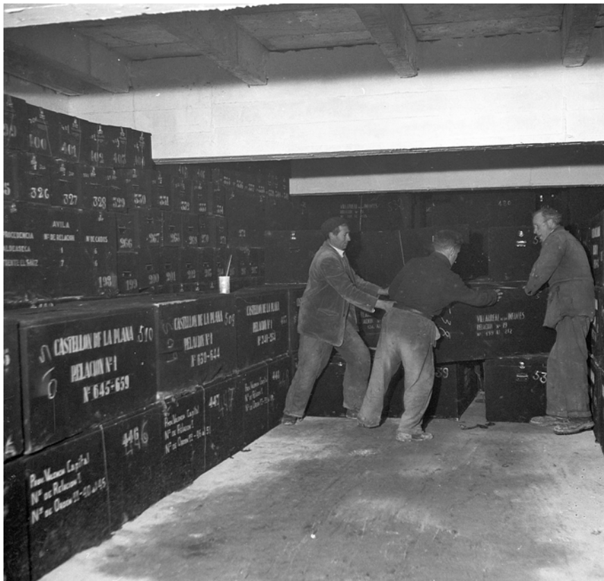
A l'esquerra, Franco i Carmen Polo, visiten les obres del Valle de los Caídos, l'any 1940. A la dreta, trasllat de les restes al complex, als anys 50. Una de les caixes conté restes de Castelló.

diverses reclamacions de familiars transmises a la comissió a través de l'Agrupación de Familiares Pro Exhumación. Els experts, tot i mostrar-se sensibles amb aquestes peticions, alertaven de les dificultats tècniques d'identificació.