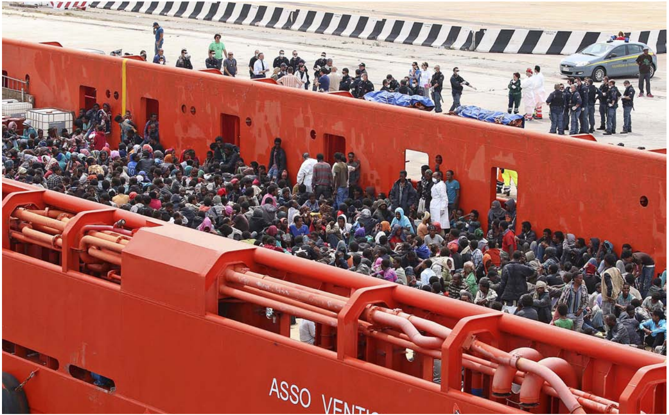
Les imatges de refugiats arribant a Itàlia s'han repetit durant el 2014. La tragèdia de Lampedusa, on van morir 366 persones, va ser-ne la més dramàtica.

M és de 150.000 refugiats han arribat enguany a les costes d'Itàlia; la majoria han anat cap al nord. Mentre Europa lluita per una nova estratègia, els traficants de persones es fan d'or. Més enllà del bar La Grotta s'acaba Itàlia: confino di stato , la frontera estatal. A l'estreta carretera en direcció a França, entre el mar i els penya-segats, hi ha un punt de trobada per a immigrants il·legals i traficants.