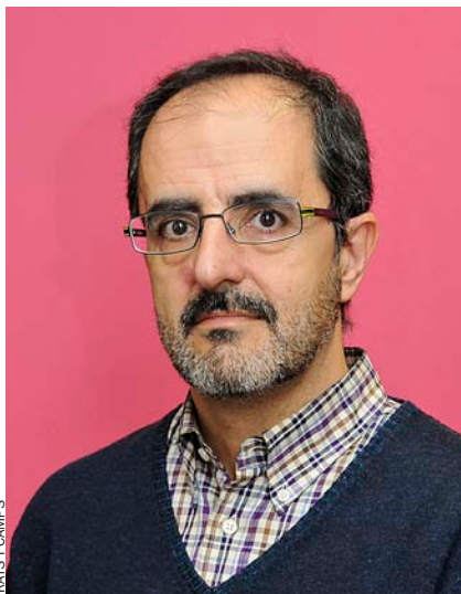
Anselm Bodoque opina que “Fabra no aporta cap vot singular, no té cap capacitat mobilitzadora entre l'electorat del PP”.

resultat que ja no podran capgirar, Català és millor candidata que Bonig, i totes dues millors que qualsevol altre”.