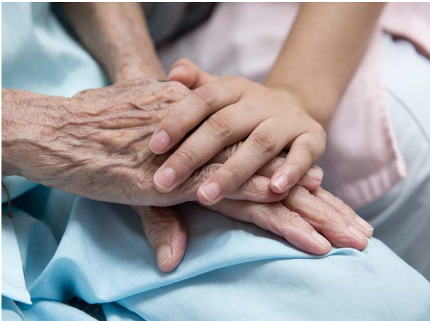
A Bèlgica qui sol·licita l'eutanàsia ha de poder estar en plena capacitat de raonar. La xarxa de metges LEIF assessora els de capçalera i els dóna suport.

ser millors amb els seus pacients, més compassius. També hi està d'acord Distelmans.