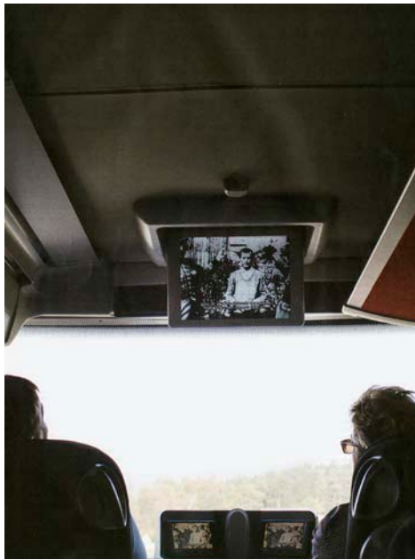
Els participants miren un documental de camí a Birkenau. A la dreta, el grup belga a Auschwitz-Birkenau: els metges que prenen la vida.

A Bèlgica qui sol·liciti l'eutanàsia ha de poder estar en plena capacitat de raonar. Haurà de fer constar per escrit la seva voluntat i l'ha d'expressar en repetides ocasions. Llavors examina el metge si la persona es troba a l'estadi final de la malaltia. Li explica quins