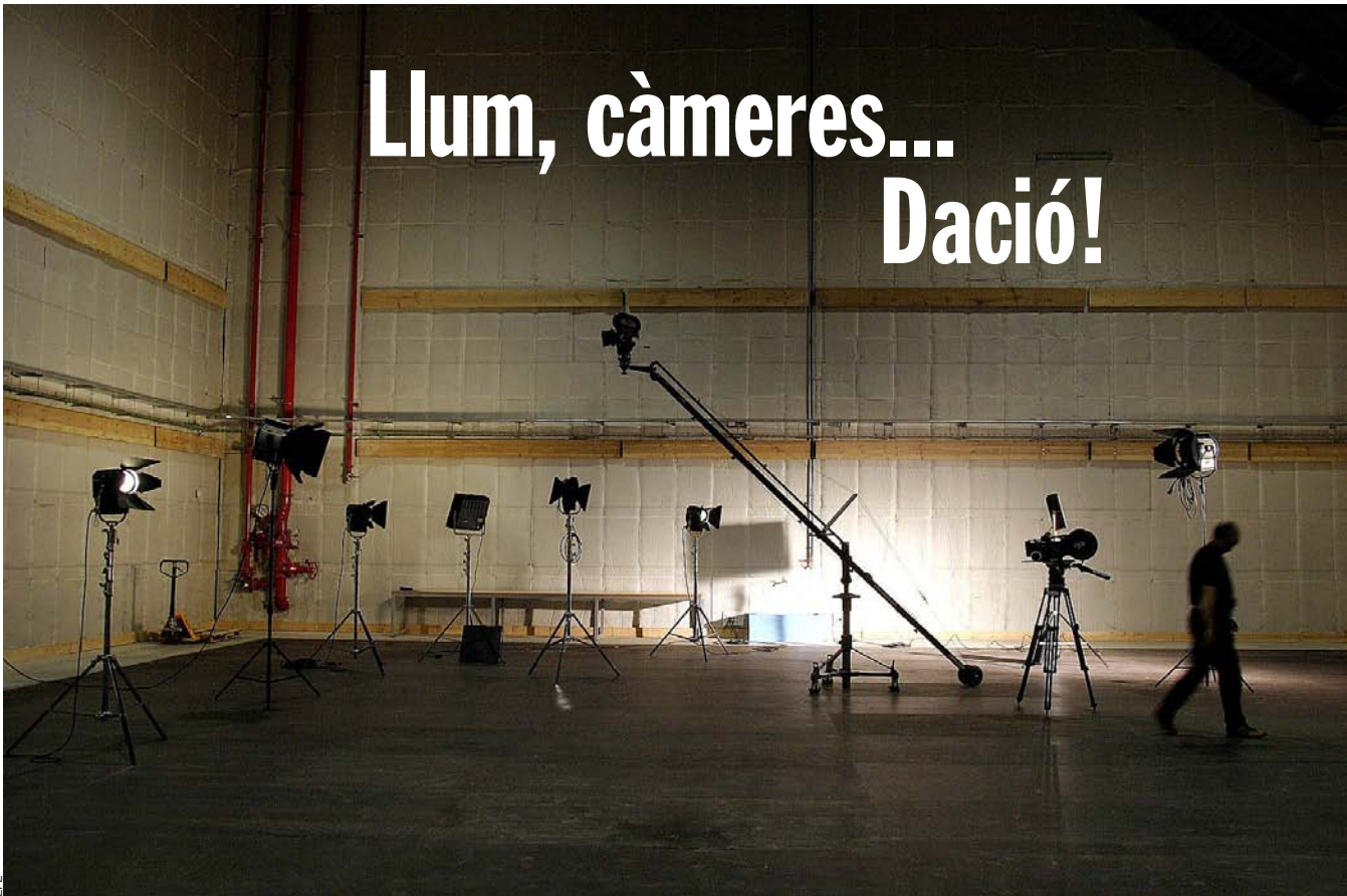
Un dels sis platós de la Ciutat de la Llum d'Alacant, un macrocomplex cinematogràfic ruïnós del qual la Generalitat Valenciana s'ha de desprendre.

El 2005 la Generalitat Valenciana va inaugurar a Alacant la Ciutat de la Llum, uns estudis de cinema capdavanters que van costar 274 milions d'euros. Segons la UE, la inversió era ruïnosa i significava competència deslleial, motiu pel qual ha urgit a vendre les instal·lacions, inactives de fa tres anys. Francis Ford Coppola i uns socis seus proposen de quedar-se-les abonant només 80 milions, el deute que arrossega el complex.