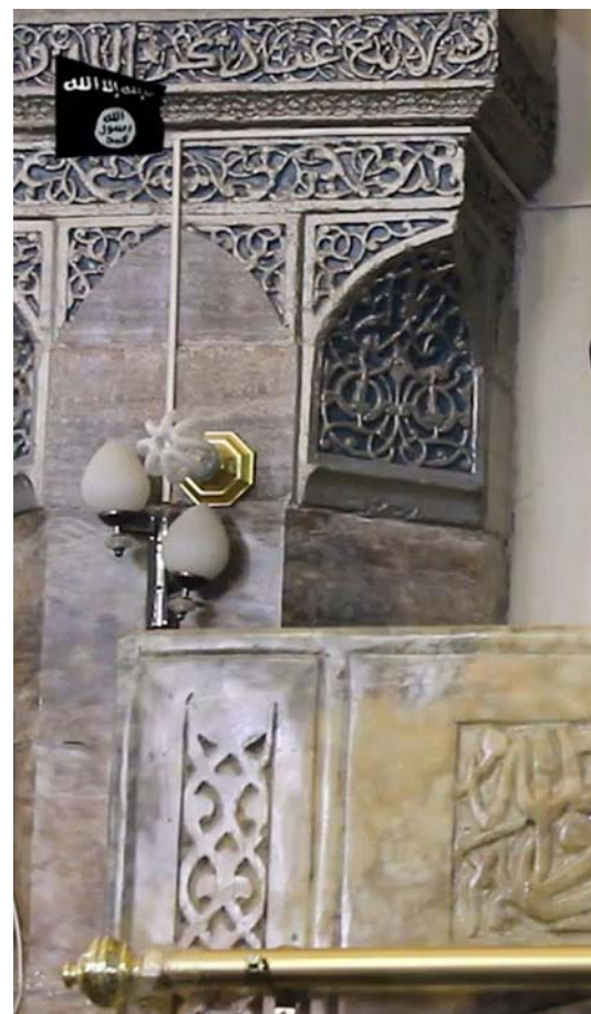
Al-Baghdadi ha convertit, en poc més de tres

Aquest centre de detenció, creat el 2003 i tancat el 2009, fou un dels camps més polèmics pels abusos perpetrats pels soldats nord-americans sobre els interns. Trepitjaven exemplars de l'Alcorà com a befa a la religió musulmana, obligaven els presoners a despullar-se i se'n reien, els humiliaven amb tot tipus de pràctiques vexatòries... A més, hi moriren un nombre indeterminat de detinguts, oficialment per “causes naturals”, cosa que va ser negada pels familiars, els quals asseguraren que el motiu dels decessos havia estat les tortures. No era estrany, doncs, que la resistència tingués aquest camp com un dels seus objectius més preats. L'atacà directament en nombroses ocasions amb coets, i provocà víctimes tant entre les forces militars com entre els presoners, i indirectament l'assetjava fent-hi difícil l'accés –mitjançant mines amagades a les carreteres, explosions de cotxes bomba, atacs de guerrillers... – de manera que la Creu Roja acabà no visitant-lo pel