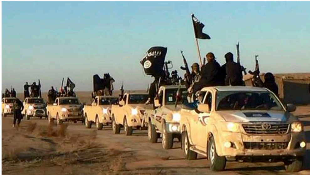
La perfecta organització que ha imposat Al-Baghdadi a Estat Islàmic podria assegurar la pervivència del grup més enllà de la mort del seu líder. Els vídeos de propaganda, que mostren les victòries d'Estat Islàmic, són un efectiu sistema de captació de voluntaris.

devora la frontera amb Síria. Un dels portaveu d'Estat Islàmic, Abú Mohammed Al Adnani, va confirmar el dia 10 l'atac, a través del seu compte de Twitter: "Penseu que la successió ha acabat? Tranquil·litzem la nació. Abu Bakr al Baghdadi és okay gràcies a Déu i li desitgem una recuperació ràpida".