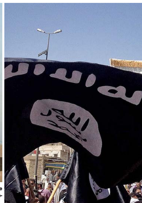
El terror és una arma fonamental d'Estat Islàmic, el qual l'emet a través dels vídeos pujats a internet que mostren com degollen occidentals. La bandera negra d'Estat Islàmic s'ha fet famosa en els últims sis mesos, i ha superat en admiració Al-Qaida entre els simpatitzants de l'islamisme radical a tot el món.

sumlà. Durant l'any següent, 2012, hi envià efectius per organitzar els primers escamots que serien l'embrió del seu particular exercit siria. A mesura que, paral·lelament, anava conquerint territoris a Iraq, especialment els situats a zones petrolíferes –gràcies a la qual cosa ingressa ingents quantitats de doblers per comprar armes en el mercat negre–, el líder terrorista s'anava fent cada cop més fort. El 2013 rivalitzava amb el successor de Bin Laden obertament. Quan a finals d'aquell any –seguint el relat de The Telegraph – Al-Zawahiri li