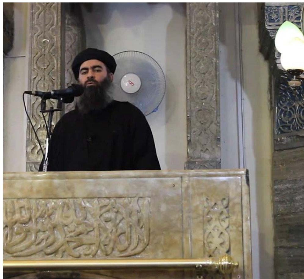
anys, un grup terrorista com tants altres en la principal amenaça per a Occident.

fet que tota la zona va ser declarada oficialment “insegura”.