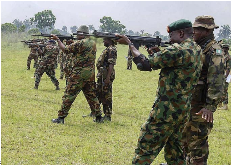
l'exèrcit nigerià, un dels més grans de l'Àfrica, té un arsenal antiquat i les tropes poc formades.

La ciutat de Chibok, situada a la zona nord-oriental de Nigèria, està pràcticament en ruïnes. Fa uns quants mesos, alguns membres del grup d'extremistes Boko Haram hi van segrestar més de 200 nenes. Darrerament, els insurgents i les tropes del Govern han lluitat pel control dels districtes de la ciutat i les zones rústiques que l'envolten, i el resultat de tot plegat han estat molts incendis que n'han cremat una gran part.