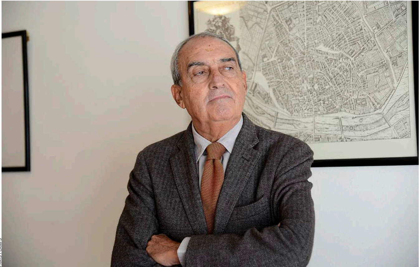
PRATS I CAMPS

lions d'euros del Fons Feder, segons publicava aquesta setmana Levante-EMV ?