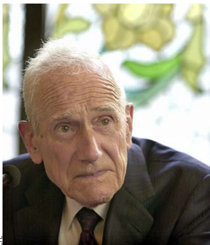
Antoni Maria Badia i Margarit.

Era la universitat de la primera dictadura, hi havia hagut "renúncies, exilis i una depuració de funcionaris que va provocar expulsions i confinaments". Segons explicava Badia, a la universitat, en aquell moment, "tot estava molt desatès". Ell, però, va poder realitzar la seva tasca, no sense algun ensurt –com el que explica Maria Teresa Cabré a l'entrevista d'aquesta pàgina– que l'obligava a deixar una temporada Barcelona i visitar una universitat estrangera. Unes voltes per obligació