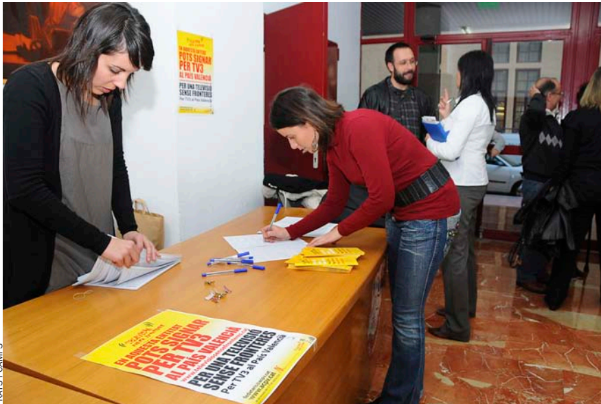
PRATS I CAMPS

La recuperació del senyal de TV3 fou motiu també d'una ILP que, en aquest cas, va ser rebutjada pel Congrés dels Diputats.