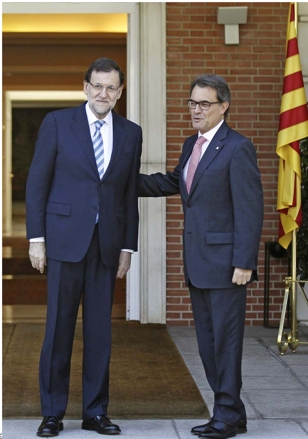
Un Consell Catalano-Espanyol permetria als dos Estats mantenir una relació de cooperació en diversos àmbits com les polítiques econòmiques i financeres, la defensa i la seguretat.

Pel que fa al repartiment de béns i deutes, no hi ha gaire escrit. L'Assemblea de les Nacions Unides només n'ha assumit dos tractats, les convencions de Viena de 1978 i 1983. El primer tracta sobre la successió d'Estats i el seu efecte sobre els tractats internacionals.