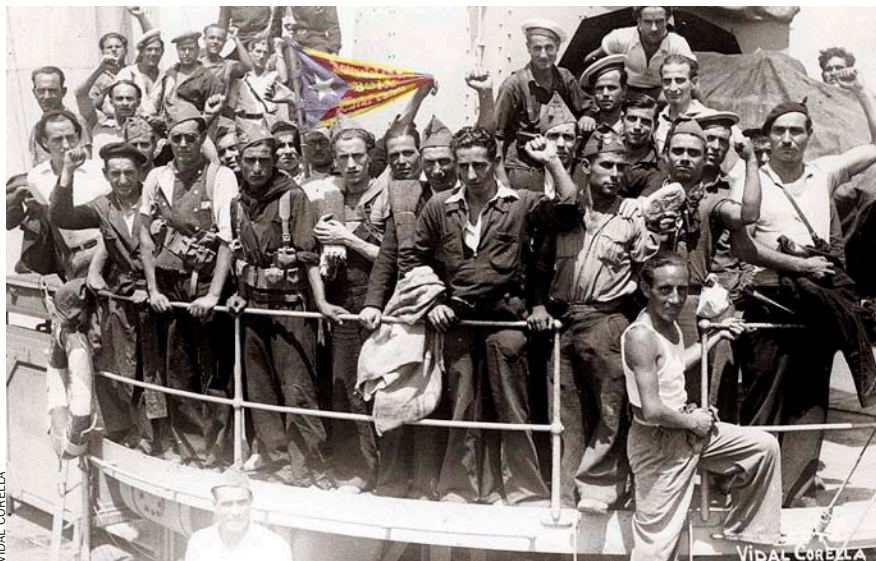
Milicians d'Estat Català abans de desembarcar a Portocristo en l'intent de conquesta de Mallorca el 16 d'agost de 1936.

pa polític europeu de les nacions sense estat. Si Catalunya obtenia la sobirania plena, deia un llarg informe francès, els catalans del Rosselló francès voldrien unir-se'ls, els alsacians reclamarien el mateix en relació amb Alemanya i així