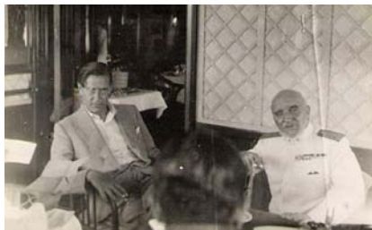
El cònsol italià a Barcelona, Carlo Bossi, en una imatge del 1939.

L' esclat de la Guerra Civil espanyola l'estiu de 1936 va obrir una sèrie d'escenaris del tot impossibles en els anys anteriors. Des de la revolució anarquista o comunista a la possible independència de Catalunya, des de la invasió francesa fins a la creació d'un Estat o unitat territorial més o menys aproximada al que definiríem com Països Catalans. La qüestió era molt simple però alhora complexa en l'àmbit nacionalista: la geopolítica situava Catalunya, el País Valencià i les illes Balears en una zona del Mediterrani occidental que semblava poder jugar un rol decisiu en una futura conflagració europea. A més, els efectes d'un possible moviment de fronteres i dels mapes del sud europeu implicarien també temences per part de la República Francesa respecte a la influència que aquesta opció pogués tenir en les comarques catalanes del Rosselló i en el Coprincipat –francoespanyol– d'Andorra. El quadre es dibuixava de la següent manera començant, com a motor de tot plegat, amb la importància central de la sort de Catalunya en un final de la guerra espanyola que restaria del tot obert fins als darrers moments del 1938. El Principat, amb un govern autònom a les mans d'Esquerra Republicana de Catalunya i presidit per Lluís Companys, esdevindria des del dia després de l'inici del conflicte un dels focus de l'atenció diplomàtica de les diferents potències implicades en la guerra. Tothom en els cercles diplomàtics i militars europeus augurava que, de manera més o menys im-