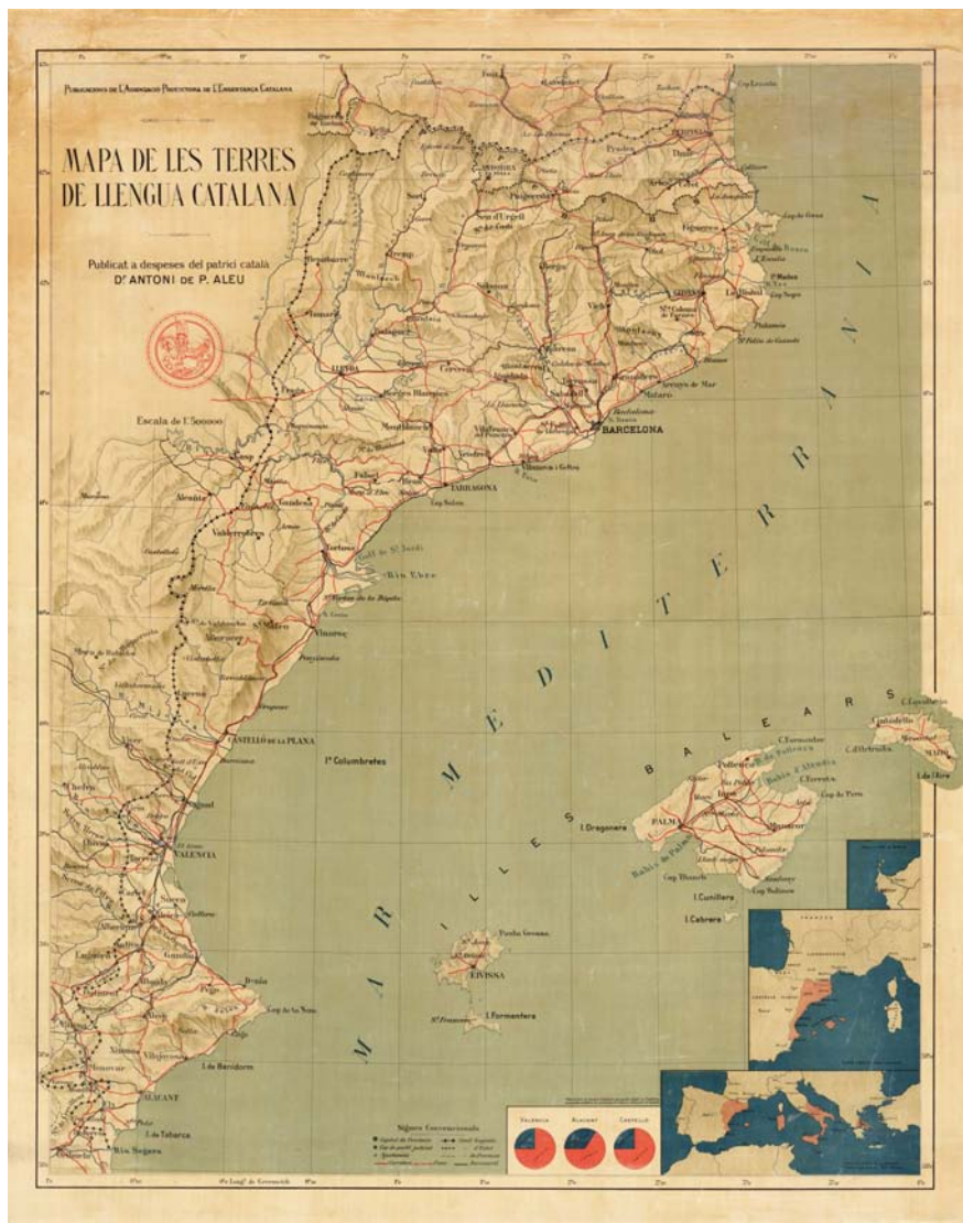
La geografia era clau per a la importància dels Països Catalans en l'escenari europeu. Mapa de l'Unió Excursionista de Catalunya de finals dels anys 1920.

En definitiva, un paper a jugar per Catalunya –ampliada o no amb les Balears– amb relació a les posicions imperials de França i a la seguretat de les seves fronteres metropolitanes que es creia que podria arribar a ser de gran transcendència. De fet, els possibles escenaris encara eren més complexos i flexibles. Ja als inicis de la guerra, el 21 d'agost del 1936 la diplomàcia feixista italiana creia veure plans francesos per crear una Catalunya-Balears independent però controlada pel govern republicà espanyol quan explicava el suposat pla del líder sindicalista francès Léon Jouhaux a través de les informacions facilitades pel General Mola: “Ell [Jouhaux] hauria aconsellat abandonar Madrid i retirar-se, amb la resta de l'exèrcit i amb les milícies, a València per resistir –si és possible– i, en cas contrari, a Catalunya, fent d'aquella regió i de les Balears el punt inflexible de la resistència roja”. I afegia: “En aquest cas Jouhaux ha promès l'ajut incondicional del ‘front popular francès’ en homes, armes, avions i tècnics. El pla consistiria per tant a organitzar una Catalunya que restaria separada de l'Espanya nacionalista, que posseiria les Balears i que seria un peó francès al Mediterrani”. Pla que, segons l'informe italià, explicaria els esforços catalans per ocupar Mallorca tot i les grans pèrdues que estaven patint a l'ofensiva