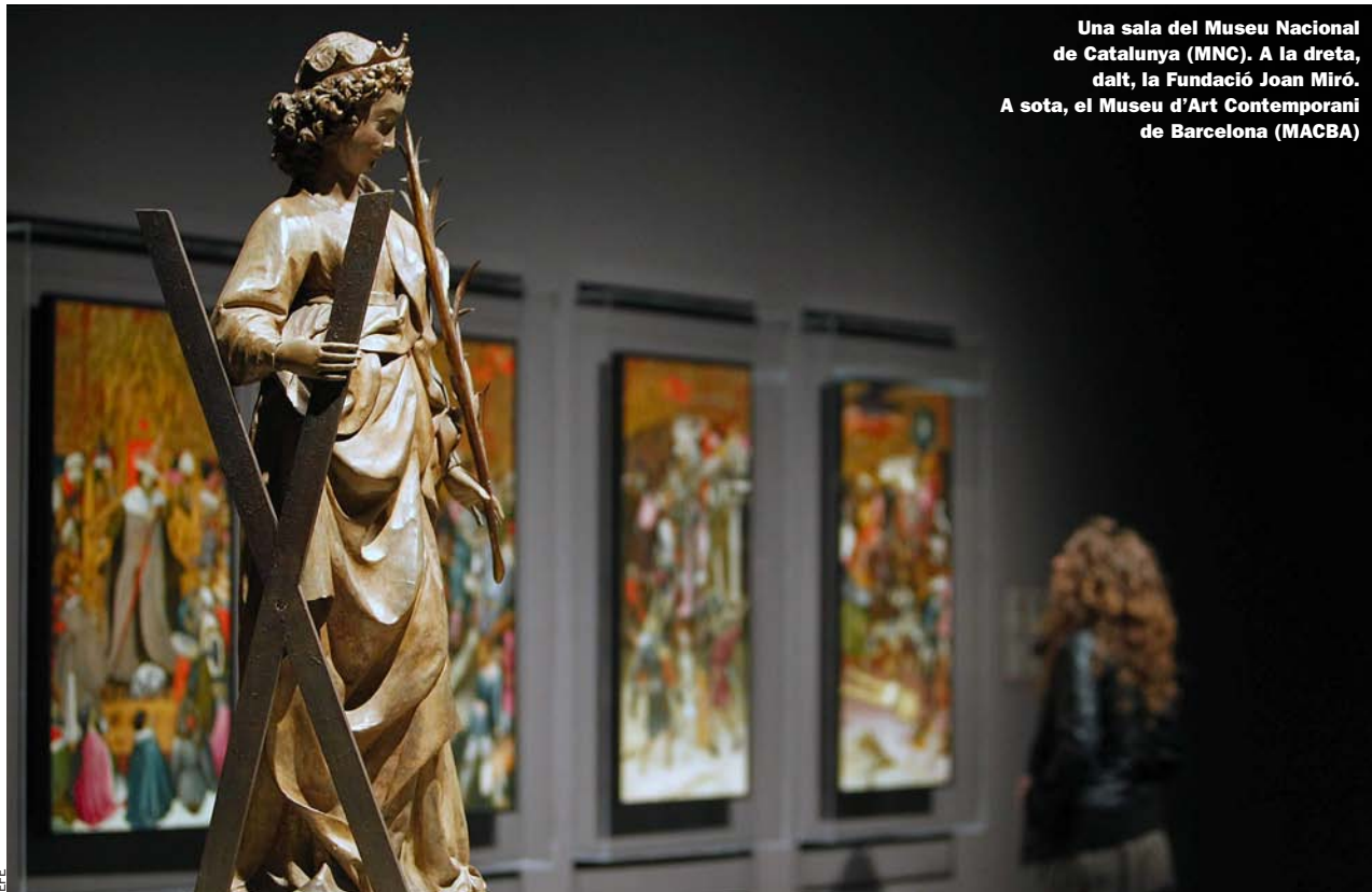
Una sala del Museu Nacional de Catalunya (MNC). A la dreta, dalt, la Fundació Joan Miró. A sota, el Museu d'Art Contemporani de Barcelona (MACBA)