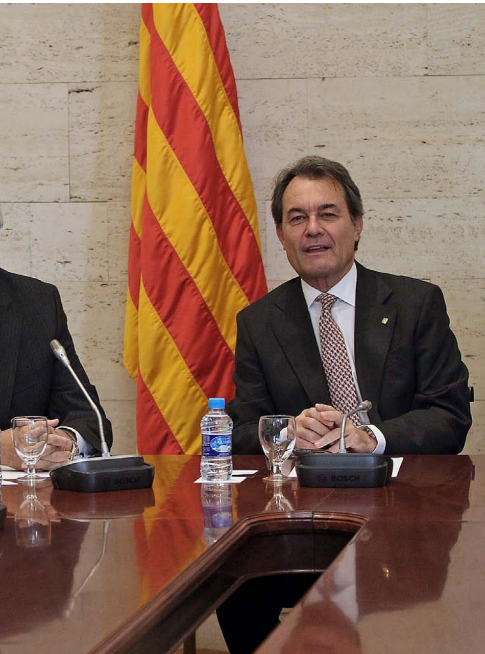
l'Estat, Eduardo Torres-Dulce, i el president de la Generalitat, Artur Mas, el passat juliol.