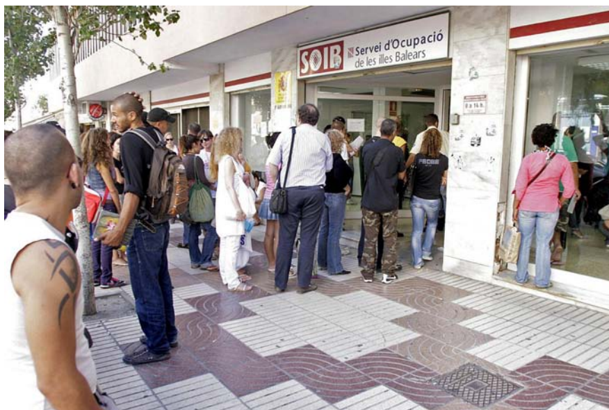
Malgrat que el president Bauzà tregui pit perquè l'atur descendeix, la majoria de sous són tan magres que ningú veu la recuperació per enlloc.

la seva ràbia contra el PP dient a les enquestes que no sap si votarà ni, si és que sí, a qui (en tots els sondejos hi ha una mitjana d'un 40% d'indecisos) acabarà confiant encara en la força conservadora: "O som nosaltres [qui governa] o l'esquerra més esquerra que mai, i això els nostres votants ho aniran assumint els pròxims mesos i actuaran en conseqüència". L'altra font no ho veu gens clar. "Els ciutadans ens castigaran a tots i Podem recollirà molt de vot, no només d'IU i del PSOE sinó també de Més i de nosaltres. Del PP serà poc, però com que estarem tan necessitats, aquest poc serà molt i ens allunyarà de la majoria absoluta".