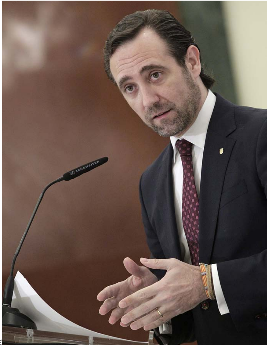
El president del Govern i del PP balear, José Ramón Bauzà, de sobte ha vist com se li enfosquia l’horitzó electoral.

L’amenaça i la reacció. I com uns postres amargs, les últimes enquestes projecten encara més ombres de futur electoral sobre el PP balear. La nova formació, Podem, irromp a les Illes amb la mateixa força, més o manco,