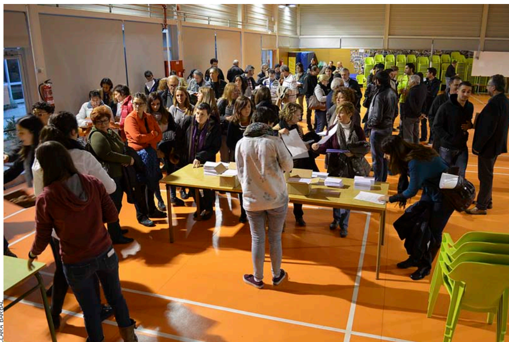
EL 9N al gimnàs de l'Institut de Tremp, l'únic local de participació que es va instal·lar a la capital del Pallars Jussà.