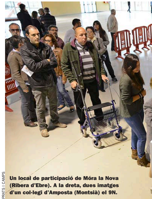
PRATS I CAMPS

Amb aquest percentatge escrutat s’han recollit 2.236.806 vots i les estimacions fan pensar que, al final del recompte total, la participació s’acostarà als esmentats 2,24 milions de votants. Cal tenir en compte que, a més, les Delegacions de