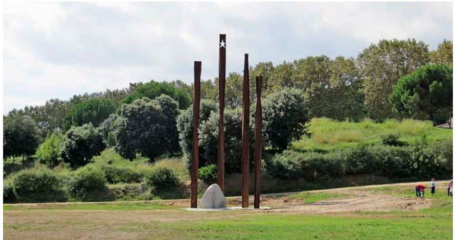
Monument a la Independència alçat al parc Jalpí d'Arenys de Munt per commemorar la consulta celebrada el 13 de setembre del 2009.

Al principi, ens explica Bilbeny, a Barcelona ningú no va veure la iniciativa amb bons ulls. "Jo tinc una carta d'un senyor que llavors era diputat d'Esquerra dient que ens havíem begut l'enteniment, que això que volíem fer