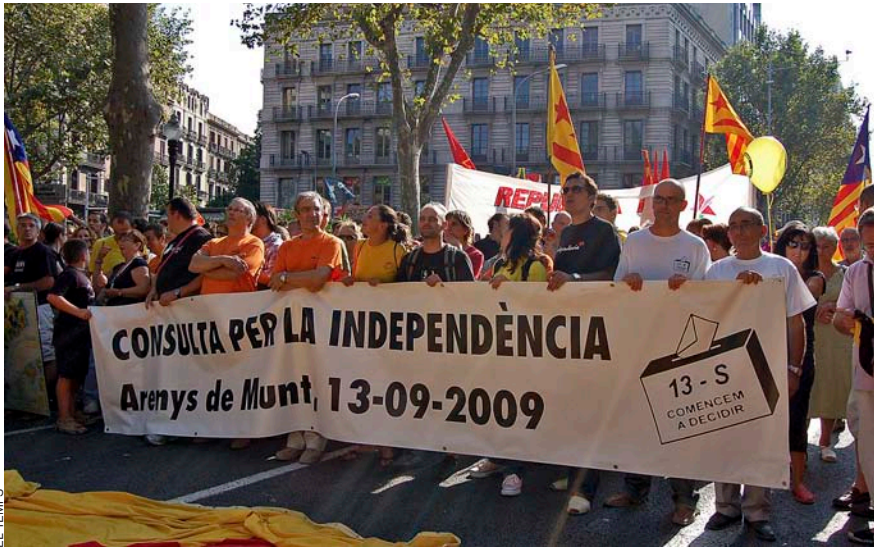
Pancarta de la consulta del 13-S durant la diada de l'11 de Setembre de 2009.

ment l'escenari i va significar el primer desafiament a l'Estat en nom del dret a l'autodeterminació.