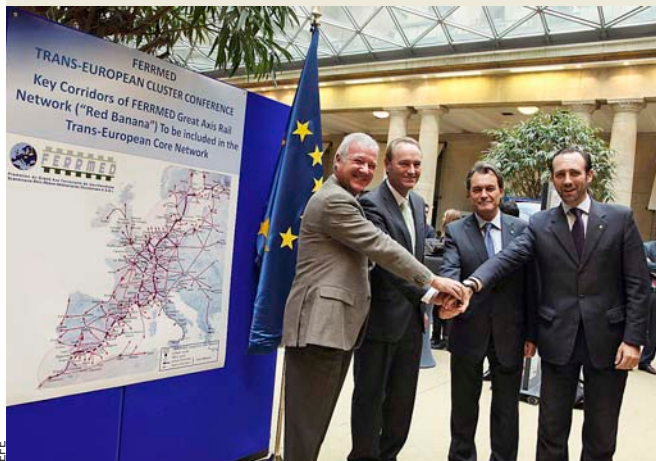
Els presidents de Múrcia, València, Catalunya i Balears l'any 2011 en un acte pel corredor mediterrani a Brussel·les.

Si bé una bona gestió és indispensable a l'hora de traure rendiment a una infraestructura, sense infraestructura no pot haver-hi gestió, ni bona ni dolenta. I de moment, el corredor mediterrani malda per ser alguna cosa més que una simple entelèquia, per més que, en els seus discursos, els polítics s'omplen la boca parlant-ne. Tres anys després que la Unió Europea incorporara aquesta infraestructura en la Xarxa Transeuropea de Transport com un dels seus deu eixos prioritaris, encara queda molt de camí per recórrer.