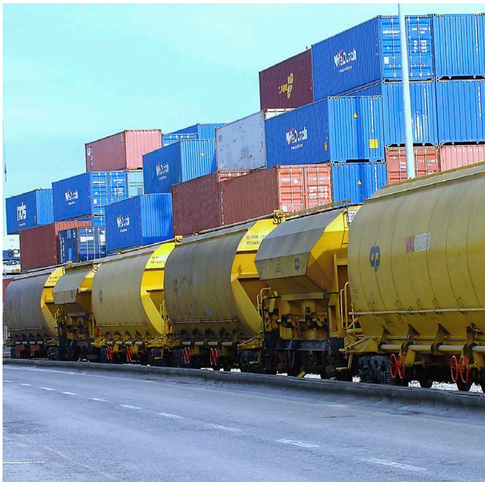
Tot i que el transport de mercaderies fou liberalitzat l'any 2005, Renfe continua acaparant el 78%

L'actitud de l'operador públic ha provocat que, nou anys després de la liberalització, el nombre de mercaderies transportades per ferrocarril disminueixi, tot just el contrari del que ocorre a la resta d'Europa. Així, mentre en l'última dècada a Europa el transport per tren ha crescut un 4% de mitjana cada any, a Espanya ha caigut a la meitat. De fet, només el 6,6% de mercaderies que entren o surten dels ports espanyols són desplaçades amb tren, una xifra ridícula si, com es diu en els discursos públics, Espanya aspira a convertir-se en la porta d'entrada dels productes amb destinació a Europa. Si una bona logística (conjunt de processos que permet assegurar el flux eficient de les matèries primeres) és essencial per a una economia avançada, l'Estat espanyol encara té molts deures per fer. "Espanya disposa d'una xarxa d'infraestructures ferroviàries