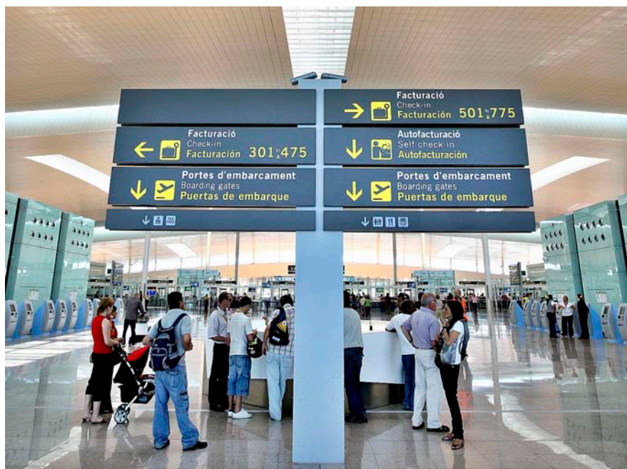
L'Estat català haurà d'assumir els 982 milions d'euros que inverteix el Ministeri de Foment en infraestructures.

Noves despeses a compte de la Generalitat. Si la Generalitat fos el Govern d’un Estat independent, i assumint que compartiria les competències i el volum d’inversió que avui té l’Es-