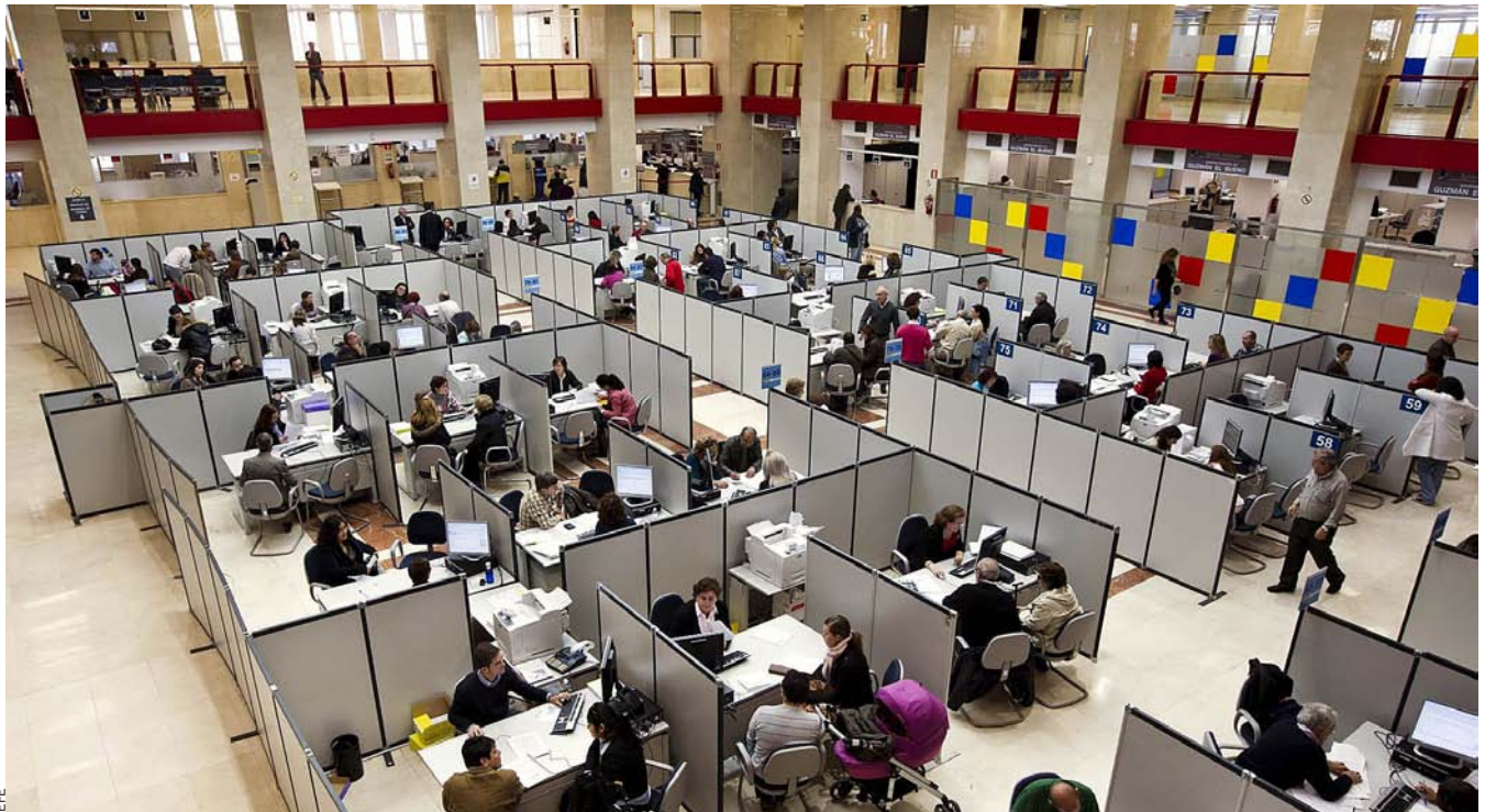
EL CATN recomana a la Generalitat que tingui preparada l'administració tributària quan comenci el període de transició política.

tat espanyol, tindria una despesa total de 8.248 milions d'euros anuals. D'entrada, hi hauria un desemborsament addicional d'uns 1.774 milions d'euros en àrees com el ministeri judicial, defensa, política exterior, seguretat ciutadana i institucions penitenciàries. Si bé en matèria de justícia, de seguretat ciutadana (Mossos d'Esquadra) i institucions penitenciàries la Generalitat té àmplies competències a la comunitat autònoma, el fet de convertir-les neta-ment en estructures d'Estat tindria un cost addicional per l'absorció dels salaris dels jutges i dels ministeris fiscals, per exemple, que avui es paguen des de l'Estat central.