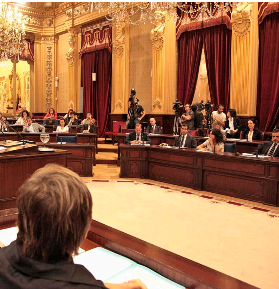
gueixen de prop la vida política balear, José Ramón Bauzá no repetirà majoria absoluta el pròxim mes de maig.

suposa que assolirà. A propòsit d'això serà "molt important saber què passa a Eivissa" quant a aliances preelectorals progressistes –tant si es fan com si no–, no debades els dos pics que l'esquerra ha governat, amb UM (1999 i 2007) ha estat sobretot gràcies al fet que tot el progressisme s'ajuntà en una sola oferta electoral i guanyà al PP a l'illa, la qual cosa impedí la majoria absoluta conservadora en el Parlament i obrí la porta al pacte alternatiu a la dreta.