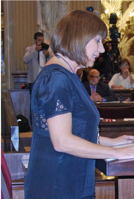
Francina Armengol es presenta com la futura presidenta del Govern després de les eleccions de l'any que ve, però no està gens clar que ho aconseguirà.