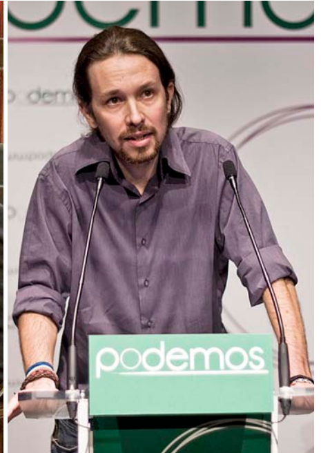
El partit liderat a Madrid per Pablo Iglesias, Podem, de moment manté a Balears un discurs segons el qual no pactarà amb els socialistes.

canviar l'any que ve. Si més no, així en fa l'efecte a hores d'ara.