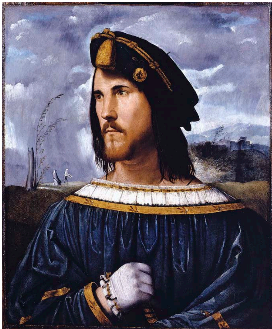
Retrat de gentilhome obra d'Altobello Melone, suposadament de Cèsar Borja. Obra dipositada en l'Accademia Carrara de Bèrgam.