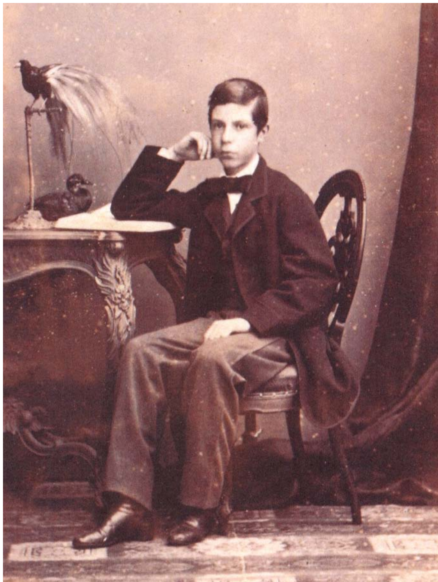
L'aristòcrata va descobrir les Balears en un viatge quan tenia vint anys.