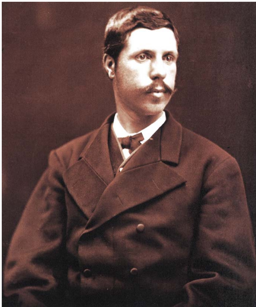
L'arxiduc Lluís Salvador va visitar moltes vegades les Illes i hi visqué anys, en períodes intermitents. Fou el pioner a excitar l'interès de l'incipient turisme cap a les Illes.

Pioner del turisme. El protagonisme de Die Balearen a l'exposició francesa dona fe de fins a quin punt Lluís Salvador fou pioner a excitar l'interès per Balears. Fins aleshores els viatgers del centre, nord i est del continent gairebé només visitaven com a norma general Itàlia i Grècia, emulant els temps, segle XVIII i principi del XIX, del Grand Tour —d'aquí ve la paraula tourisme , fixada així, en fran-