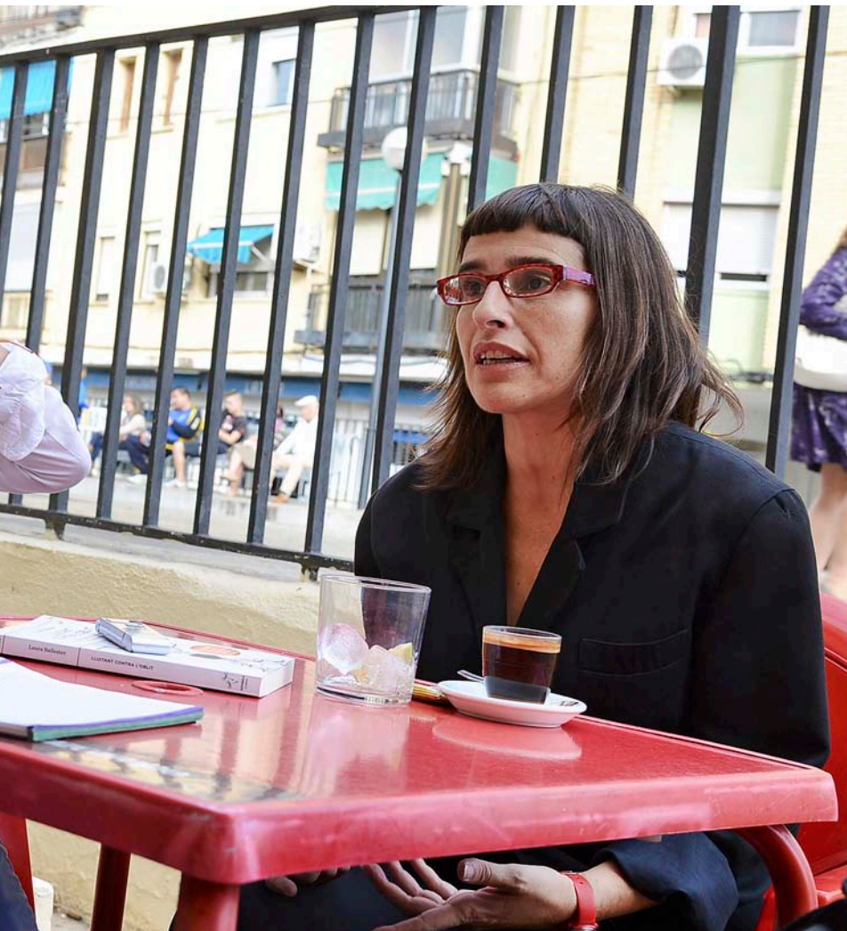
que va generar curiositat en no pocs usuaris del metro que passaren per allí.

velocitat. Totes les dades de velocitat les pose entre cometes, perquè des del moment que llegeixes la caixa negra i borres les dades... Què s'intentava amagar?