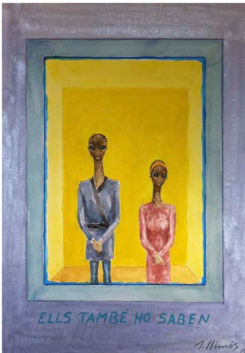
Finestra observatori de la nau alienígena - Ovni, 2014, de Robert Llimós. Vota, 2014, d'Insectotòpics.