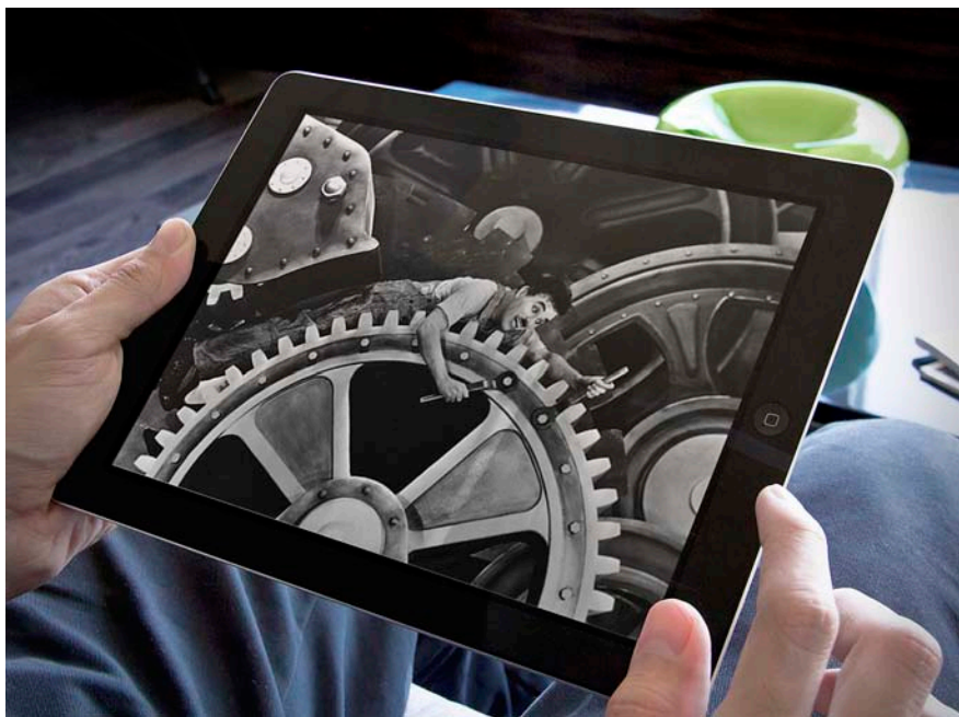
Una gran onada d'invents i avenços de la informàtica i les tecnologies de la informació i de la comunicació arriba acompanyada d'una barreja d'estrès social i transformació econòmica.

han arribat a entendre. Siri d'Apple respon amb precisió a moltes ordres de veu i pot escriure els correus electrònics i les notes que l'usuari li dicta. El programa de traducció de Google és extremament ràpid i cada vegada més precís, i els ordinadors de la companyia cada vegada entenen més allò que les càmeres fotografien (quan es fan servir, per exemple, per compilar Google Maps).