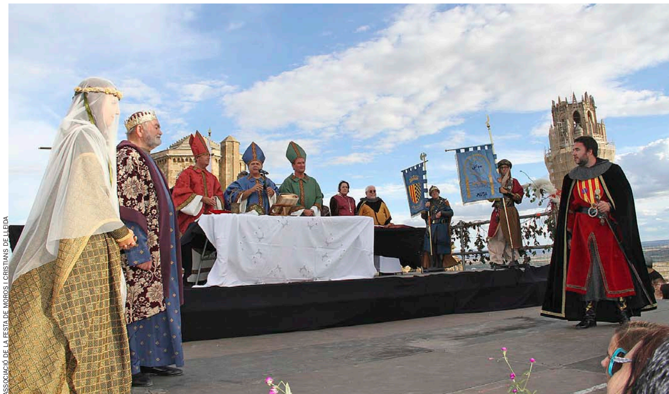
Recreació a Lleida, l'any 2013, de les noces reials entre Berenguer IV, comte de Barcelona, i Peronella d'Aragó, l'any 1150.

El llibre, titulat senzillament Ramon Berenguer IV (Rafael Dalmau Editor, 2014) és, com destaca l'autor, el medievalista Josep-David Garrido i Valls (Alacant, 1965), la primera biografia sobre un personatge cabdal en la història de Catalunya. El pes històric del seu besnét, Jaume I, i el fet d'estar parlant d'un període històric molt llunyà, el segle XII (Berenguer IV va nèixer entre els anys 1113 i 1114, no se n'ha pogut establir la data amb exactitud, i morí el 1162), fan segurament que en l'imaginari no tinga aquella dimensió fundacional.