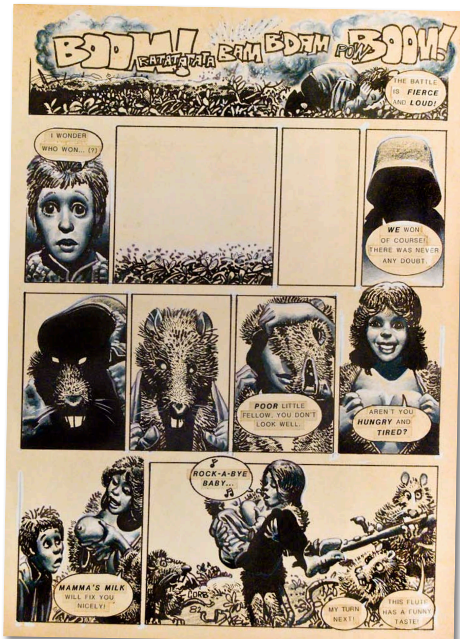
Vinyetes realitzades per Richard Corben, un dels més grans artistes que tingué el segell Toutain al llarg de la seua trajectòria.

Toutain, nascut a Barcelona el 1932, començà ben prompte com a dibuixant i guionista en publicacions com Pocholo , Historietas o El Coyote , amb creacions com El héroe de Saipán , publicada el 1950. Per alguna raó, però, canvià aquesta tasca per la d'agent d'uns altres artistes. Ho fa a través d'una agència, Seleccions Il·lustrades, amb la qual aconsegueix durant els anys 50 i 60 que els il·lustradors de la casa treballen per a diverses editorials arreu d'Europa. Algunes de les il·lustracions més venudes aleshores són les d'aventures romàntiques per a adolescents, inspirades en cançons pop, en publicacions com Marilyn o Valentine , que tingueren gran èxit a Gran Bretanya. És allà on Toutain coneix un personatge ben peculiar, l'editor Mike Butterworth, un individu amb aspecte aristocràtic de qui l'editor català escriurà als anys 80: "Era un home excepcional, propietari d'una profunda personalitat que marcava la meua, beneficiant-la, per a la resta de la meua vida". En qualsevol cas, els il·lustradors catalans i espanyols exportats per Toutain són apreciats als anys 60 pel seu estil modern, sofisticat i elegant ("mai en la història del còmic un artista no ha dibuixat dones tan belles com Pep González", va sentenciar But-