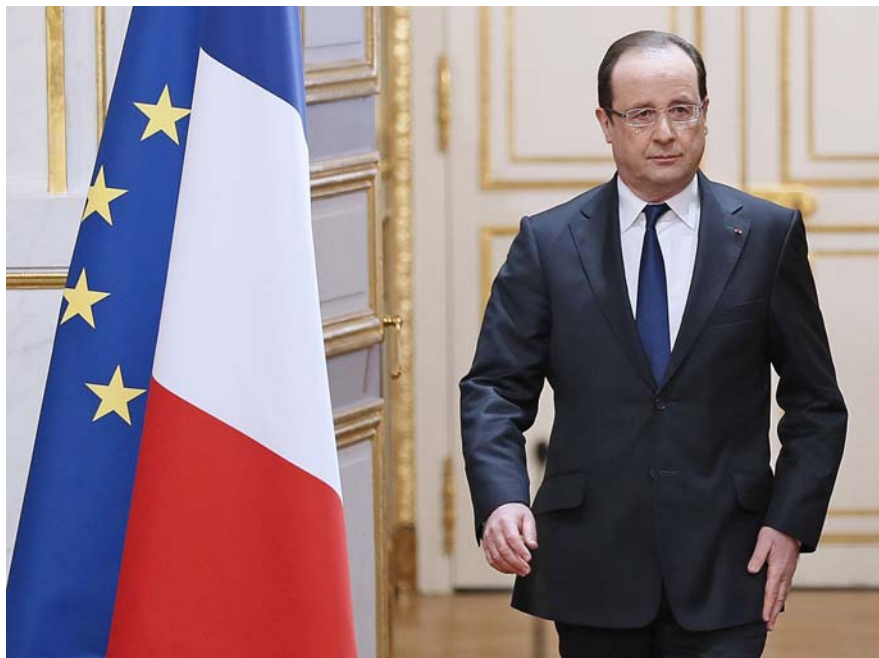
El president de la República francesa, François Hollande, va presentar el passat mes de juny la reforma de l'estructura administrativa i política de l'Estat, la qual ha generat força contestació.

El nacionalisme bretó s'ha fet notar davant de tots els francesos. Aprofitant el gran interès aixecat pel referèndum d'Escòcia i pel procés sobiranista a Catalunya, l'Emsav –vegeu requadre– va voler donar un cop d'efecte per fer visible la reivindicació nacionalista a Bretanya i Loira. El passat dissabte 27 de setembre més de 30.000 persones es manifestaren pels carrers de Nantes exigint la reunificació entre les dues regions, forçada el 1941 sota l'ocupació nazi i el règim de Vichy i confirmada posteriorment per les reformes de l'estructura de l'Estat de 1957, 1982 i 2003.