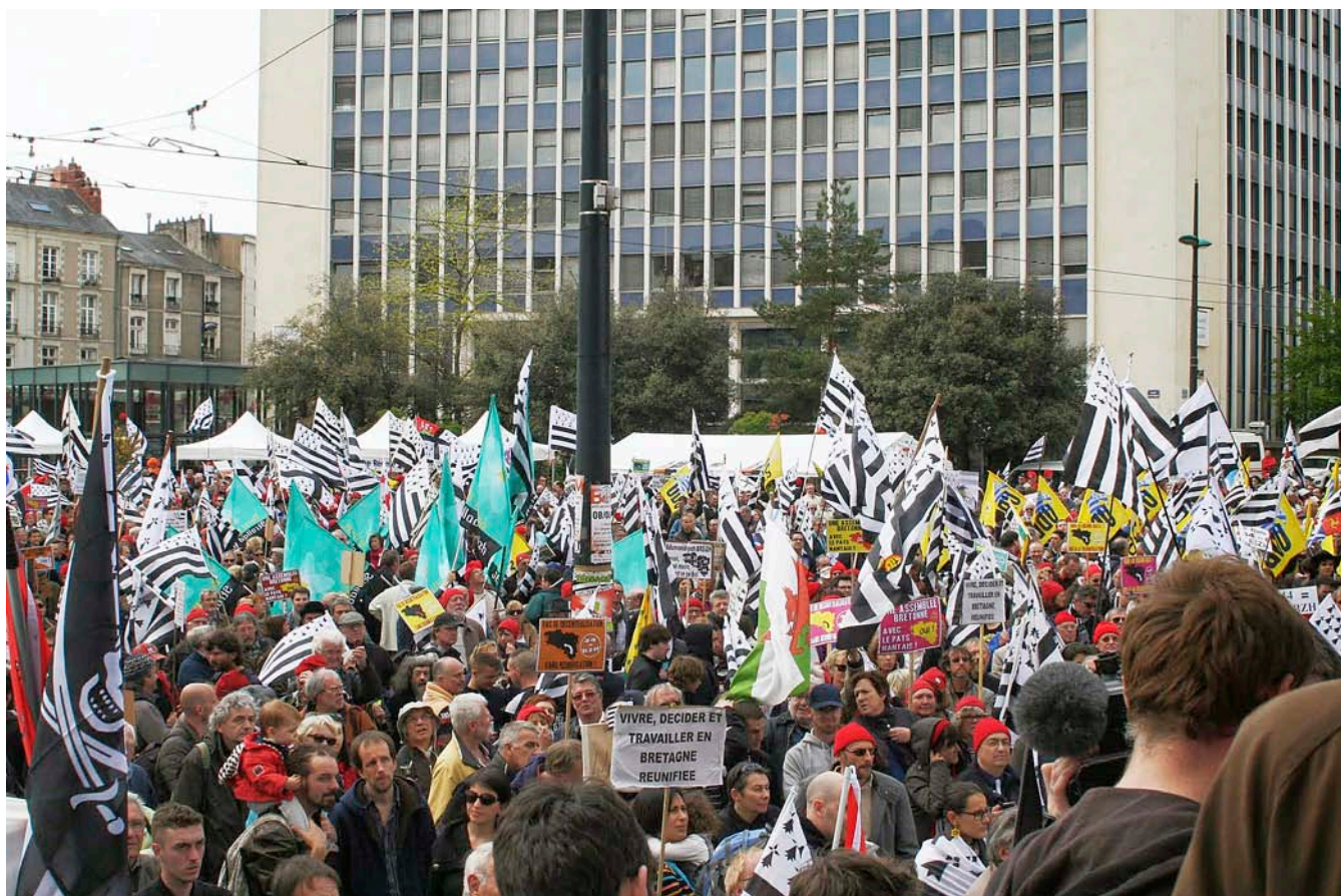
La manifestació nacionalista bretona a Nantes ajuntà més de 30.000 persones el passat 27 de setembre, un èxit que ha sorprès París.

precedents”. El diari no dubtava a relacionar el cop d’efecte del moviment nacionalista bretó amb “la celebració del referèndum a Escòcia i [...] que el president de Catalunya, Artur Mas, hagi convocat un referèndum el 9 de novembre d’independència d’aquesta rica regió del nord d’Espanya”.