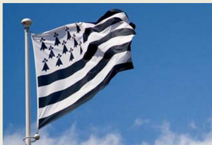
La manifestació del 27 de setembre ha popularitzat la imatge de la bandera nacionalista bretona.

El nacionalisme bretó és conegut amb el nom d’Emsav, que vol dir, en traducció literal, ‘moviment’. Si bé els seus orígens moderns cal buscar-los en els corrents de recuperació lingüística i cultural del segle XIX, la particularitat bretona recolza en l’existència d’una identitat política pròpia des de l’època medieval. En efecte, al segle VI els reis merovingis crearen el Ducat de Bretanya que, com bona part de les mateixes entitats iguals en aquell temps, gaudien d’amplis marges d’autonomia respecte del poder imperial central. Passà per diversos avatars –guerres, supressió, reinstauració...– fins que a la desena centúria va ocupar el que avui són els departaments de Bretanya i el Loira Atlàntic. Durant els cinc segles posteriors funci-