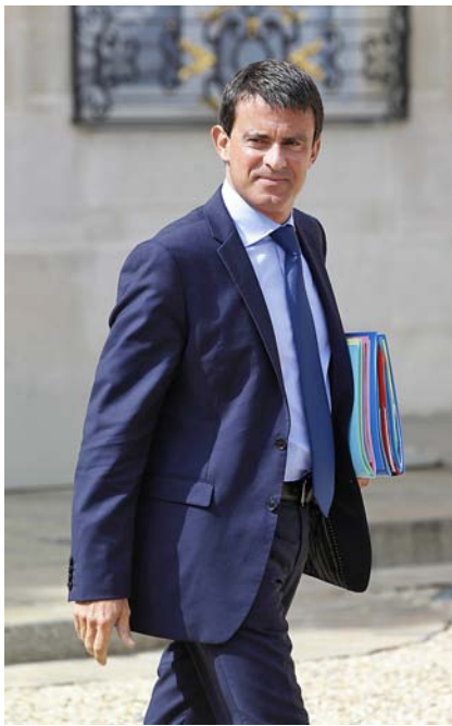
El president del Govern francès, Manuel Valls, d’origen català, és l’encarregat d’executar la reforma que pot convertir-se en un perill potencial per a Catalunya Nord.

La reforma del Partit Socialista que han concretat Valls i Hollande, i que presentà formalment el president de la República, canviarà molt el panorama administratiu i territorial. D’entrada reduirà dràsticament –si s’aprova– el nombre efectiu d’ajuntaments. Nominalment cap no desapareixerà, però tots aquells que no superin els vint mil habitants deixaran de tenir les respectives estructures administratives i polítiques. S’hauran d’agrupar amb els veïns fins que el nou consistori resultant de la suma de tots passi el