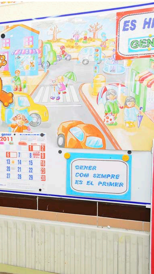
PRATS I CAMPS