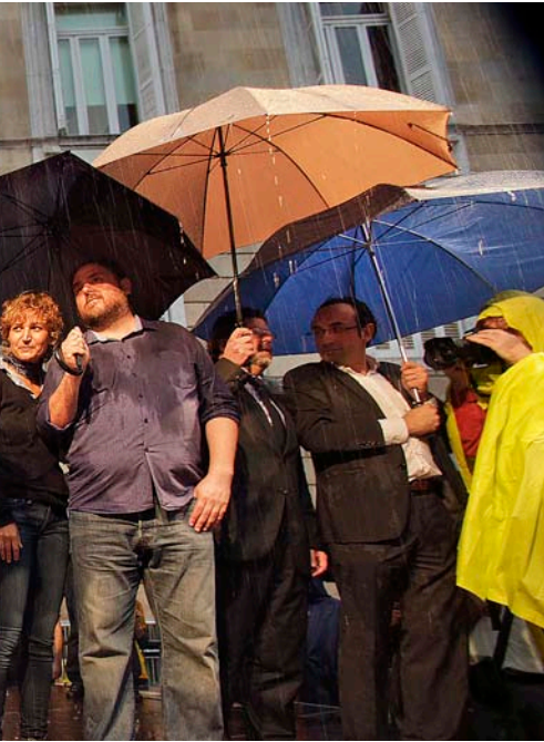
centració a favor de la consulta a Barcelona.

política, i estic disposat a canviar el meu punt de vista si els partits a favor del dret a decidir prenen una decisió conjunta.