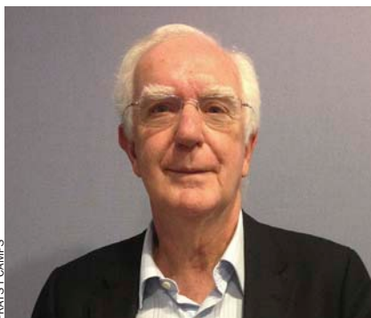
PRATS I CAMPS

problema polític i s'han de trobar solucions polítiques. Després ja veurem si guanya el sí o el no, com ha passat a Escòcia, però el desig democràtic d'una nació no es pot ignorar.