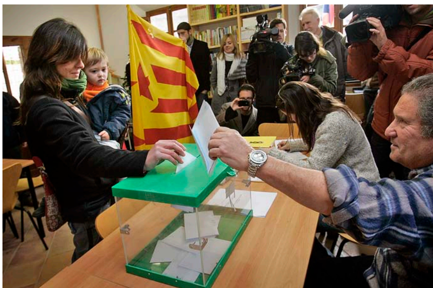
Les consultes sobre la independència que es van iniciar fa cinc anys (13 de setembre de 2009) a Arenys de Munt van ser el precedent d'una consulta oficialment convocada per al 9N.