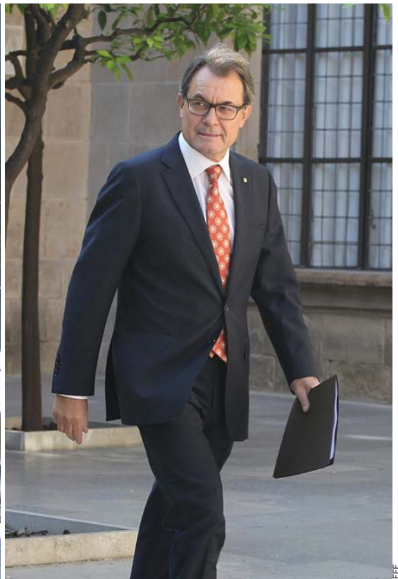
A l'esquerra, la consulta de Sant Cugat, el 13 de desembre de 2009. A la dreta, el president de la Generalitat, Artur Mas.

seu programa electoral que explicita que si aconseguixen la majoria al Parlament tiraran endavant el procés d'independència, no una consulta legal, sinó la independència perquè les eleccions substitueixen la consulta que no s'ha pogut fer”.