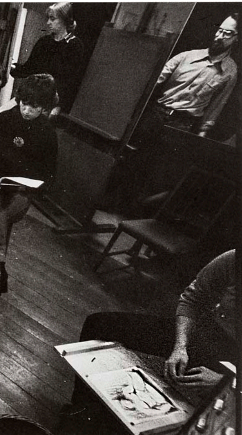
demanava que mesuraren “amb els ulls”.

gat de l'Alemanya socialista és rebutjat socialment, no sols en allò que tenia relació amb el rerefons més obscur del règim comunista. Molts altres símbols foren bandejats. I Renau i la seua obra eren, d'alguna manera, una incòmoda petja estètica del passat. Potser per aquella raó les autoritats de la ciutat d'Erfurt decidiren, l'any 2009, desmuntar el mural de Renau, un mosaic anomenat La relació de l'ésser humà amb la natura i la tècnica . La resposta fou la creació