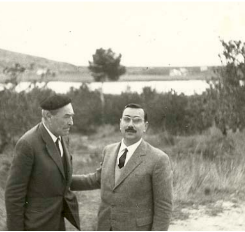
A l'esquerra, en una foto recent. Dalt, amb Josep Pla, a la bassa de Sant Llorenç. A la dreta, en l'acte en què fou nomenat fill predilecte de Tavernes de la Valldigna, l'any 2013.