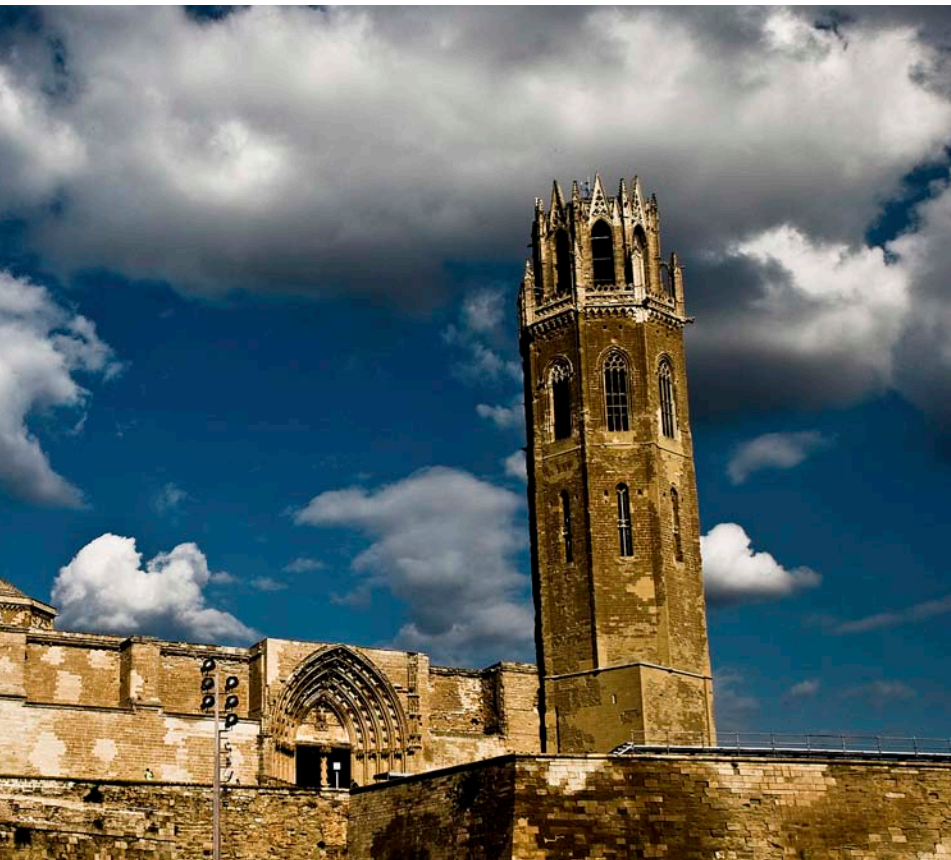
guerra de Successió.

va enfrontar les tropes austriacistes del mariscal Starhemberg i les borbòniques del duc de Vendôme avui en resta com a únic testimoni la torre de la Manresana, una torre de guaita de 21 metres d'alçada i 7 de diàmetre construïda al segle XII. L'edificació fou un observatori privilegiat del mariscal Starhemberg per controlar la zona de Calaf.