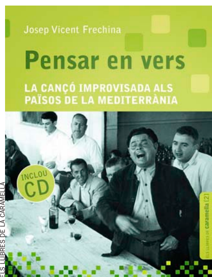
Aquest estudi de la cançó improvisada l’ha editat Els llibres de la Caramella.

—És un joc que els versadors intel·ligents [el versador inventa versos a la babalà que diu a l’orella del cantant perquè els cante] empren a favor seu: alaben un polític, precisament, per arrojar-se el dret d’estar per sobre seu, és a dir, poden alabar-ho però també poden criticar-lo. Se situen moralment en un nivell superior, perquè són els qui s’atreveixen. Per tant, si alaben algun polític, quan en critiquen un altre, la censura té més força. Moltes vegades és evident que hi ha hagut una servitud neta i pelada envers el poder. Hi ha versadors que quan tenen un polític al davant, no tenen el coratge suficient de criticar-lo, i més ara. En el passat sí que hi havia versadors que