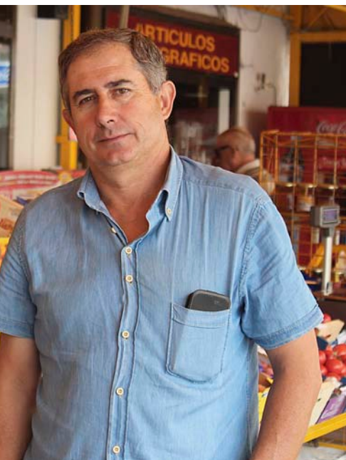
el veto li ha donat el cop de gràcia”.

rus fou anunciat un dijous”, explica el gerent de Fruites de Ponent, Josep Presseguer; “nosaltres ja teníem camions en ruta que no van poder travessar la frontera. Només aquell cap de setmana vam haver de reprocessar o donar per perduts 350.000 quilos de préssecs i nectarines amb la destinació a Rússia.” Fins ara Fruites de Ponent hi enviava diàriament 200.000 quilos de productes. Presseguer xifra el perjudici econòmic directe en uns 700.000 euros setmanals.