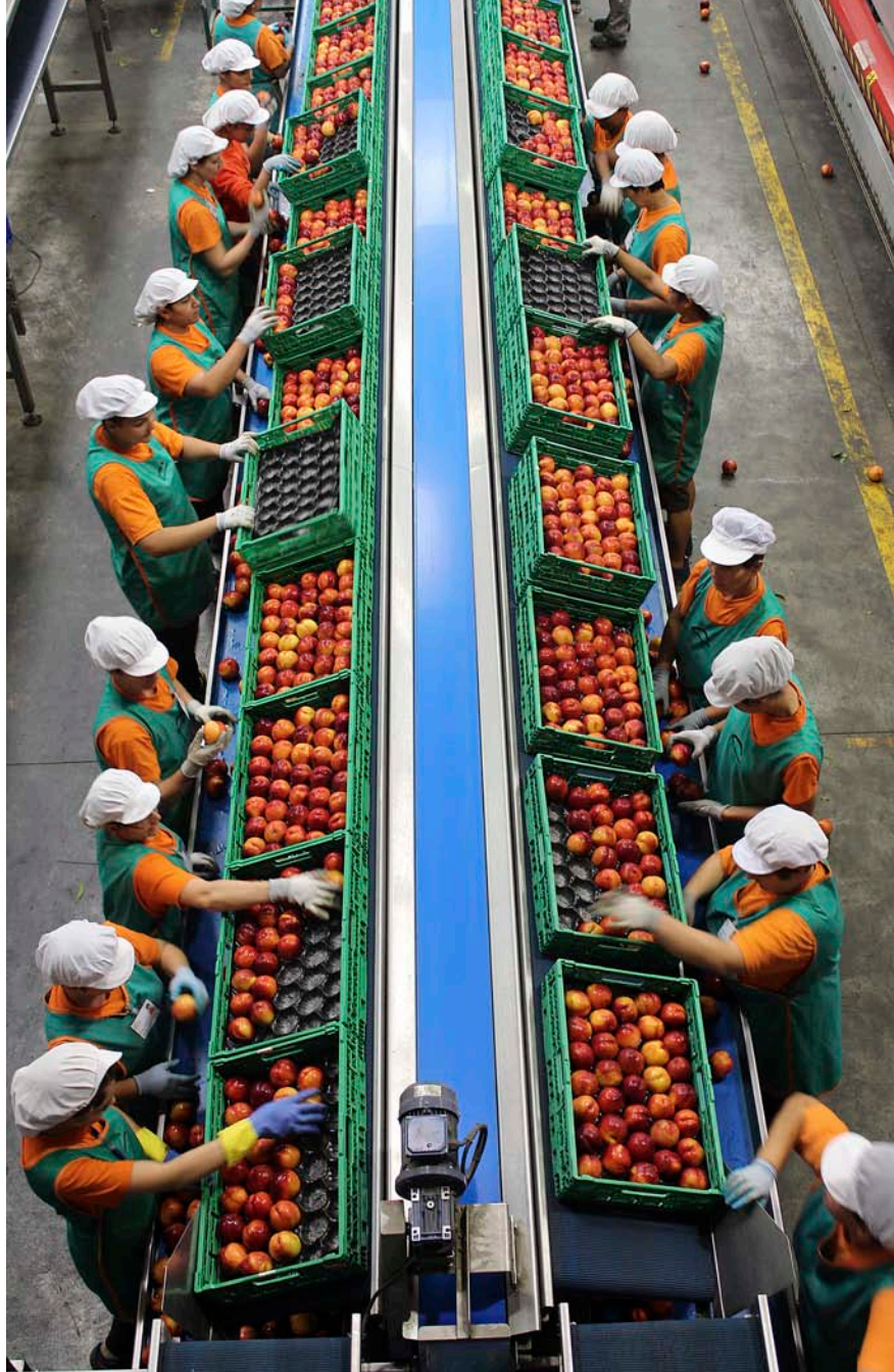
Planta de Fruites de Ponent a Alcarràs en plena preparació de la campanya del préssec i la nectarina.

Fruita passada. Quan un problema agreuja una situació complicada per ella mateixa, els russos solen fer servir l'expressió " beda (nikogda) ne prikho-dit odna ". Ve a ser l'equivalent rus de " ploure sobre mullat ". I aquesta és, precisament, la sensació que tenen a les terres de ponent, on el veto decretat per Putin els ha enxampat en plena campanya de recol·lecció i comercialització del préssec i la nectarina. El