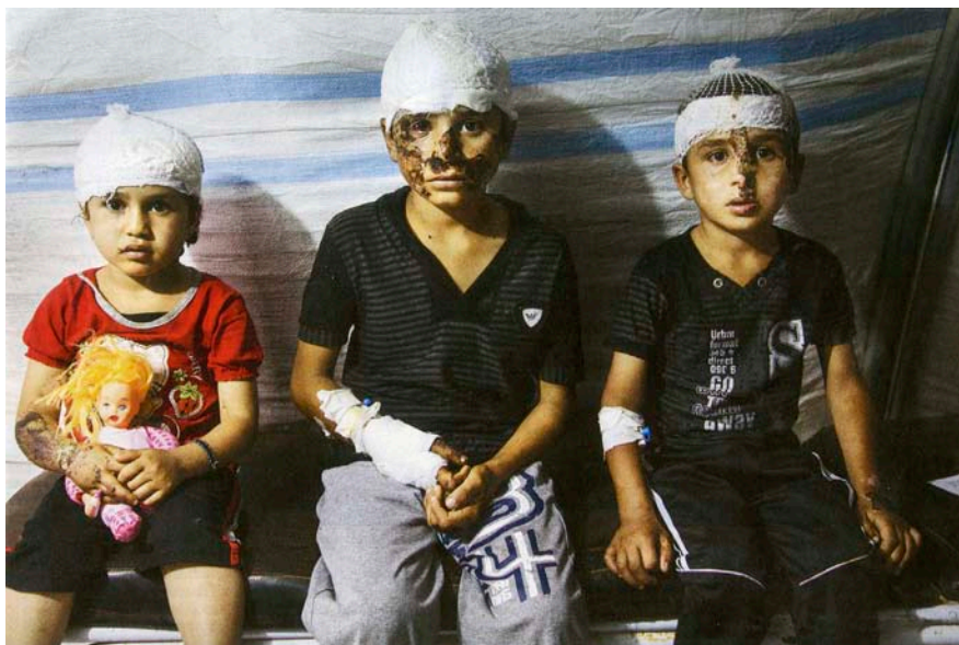
Nens hospitalitzats al camp de Newroz (Síria), que acull refugiats del nord de l'Iraq.