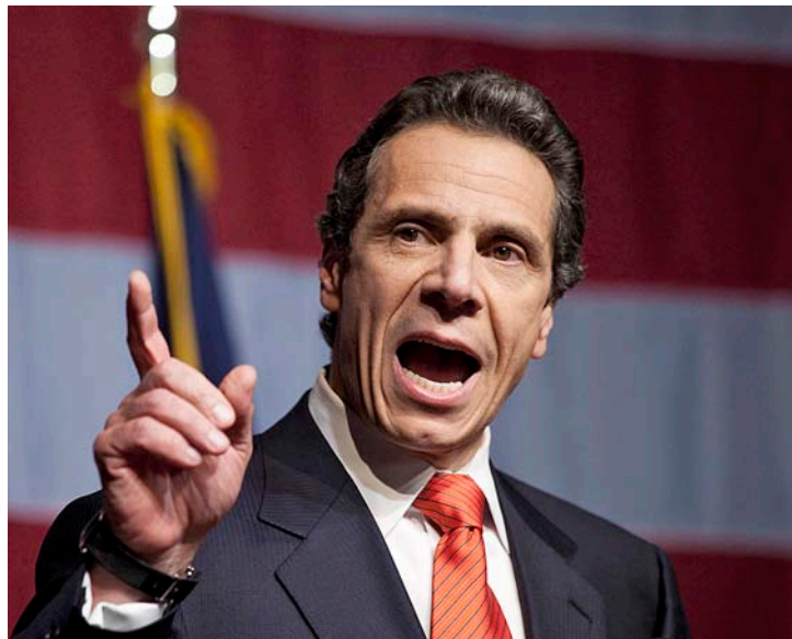
El vice-president actual, Joe Biden, i el governador de l'Estat de Nova York, Andrew Cuomo, dos demòcrates que poden lluitar per ser candidats.

demòcrates com augmentar el salari mínim, incrementar les prestacions de l'atur, abaratir l'educació universitària o reformar el sistema d'immigració seran suficients per derrotar el rival republicà. “Tenim un grup fort de possibles candidats per al 2016. Qualsevol d'ells destacaria clarament en un duel entre els demòcrates i els republicans. Els demòcrates treballem per augmentar les oportunitats de tots els nord-americans i implementar polítiques que ajuden les famílies treballadores a tirar endavant”, resumeix la portaveu.