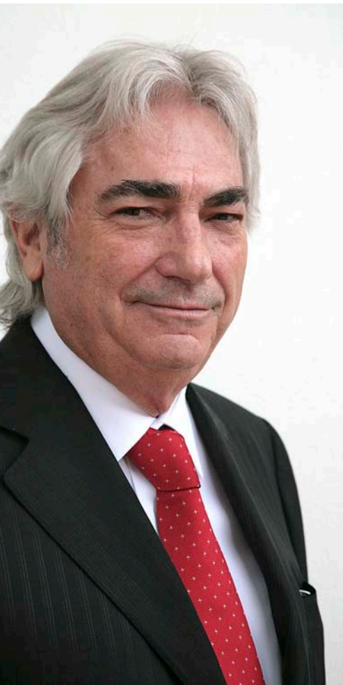
amb l'Agència Tributària el 2010.