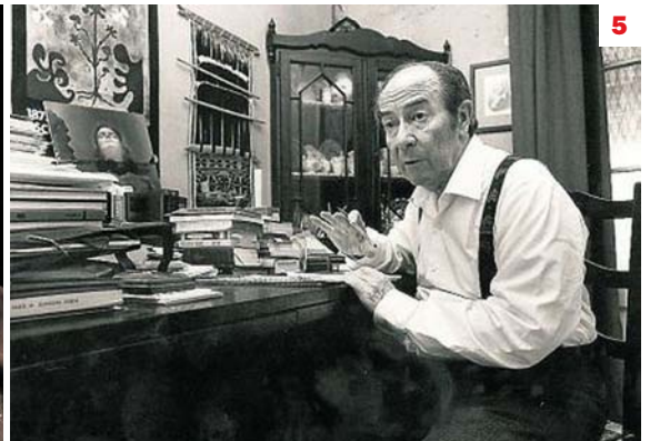
1. Vicent Andrés Estellés 2. Josep Porcar 3. Salvador Espriu 4. Narcís Comadira 5. Joan Vinyoli

per haver dedicat a l'època estival un grapat de poemes, com aquest esplèndid “L'estiu”, de Realitats (1963). “Diumenge a la tarda,/de taula eixint, havent dinat/em poso fresc, estalvio paraules (...). A fora, l'empedrat alena foc,/el temps s'empereseix, en l'aire brunzen/els mosquits de la sang –la bèstia pesa./Tot això és –com dir-ho– calent i gras i regala suor.