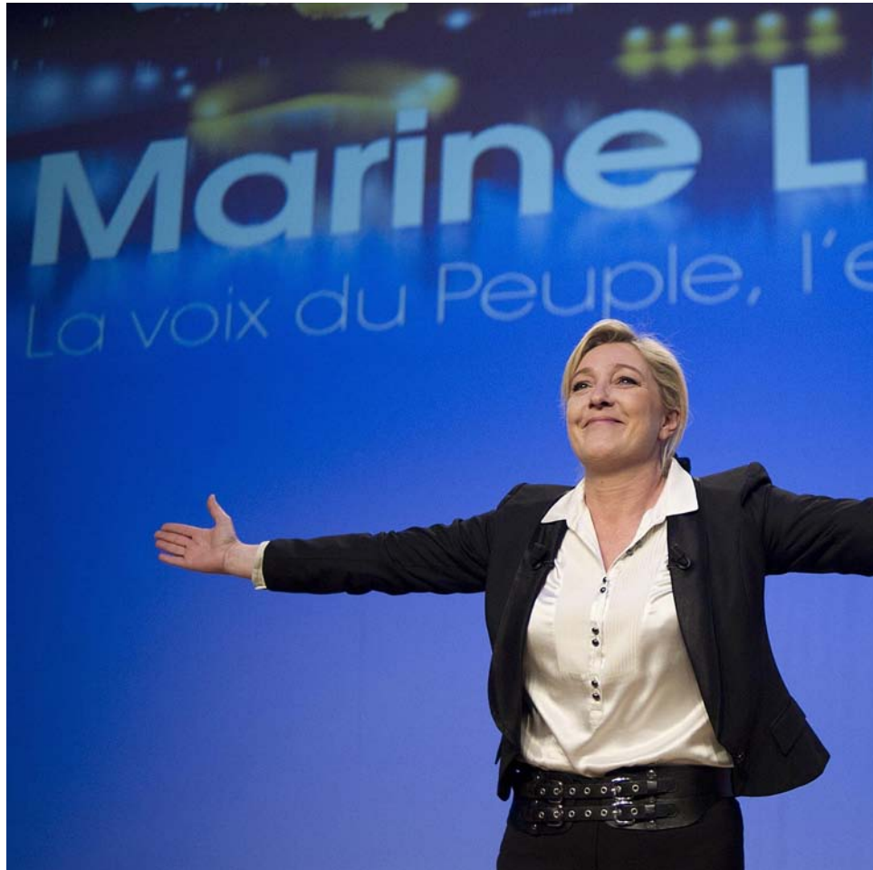
La presidenta del Front Nacional, Marine Le Pen, celebra, la nit de les eleccions europees, que el seu partit sigui el més votat a França.

“Entenc els francesos”, va dir. “Ja no hi ha valors. La família? L’amistat?”