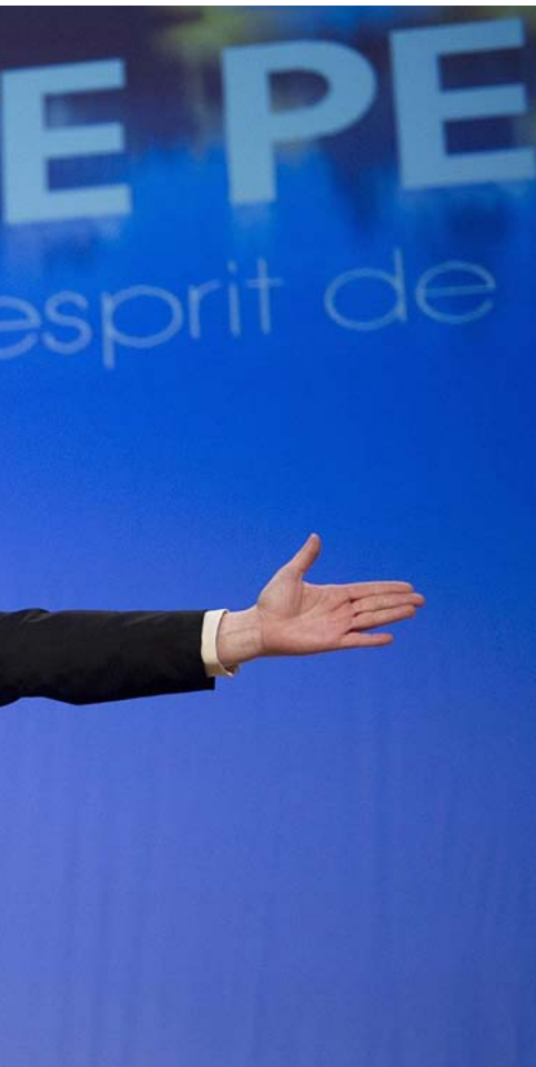
El president de la República Francesa, François Hollande, la popularitat del qual està en caiguda lliure i sembla no haver tocat fons.