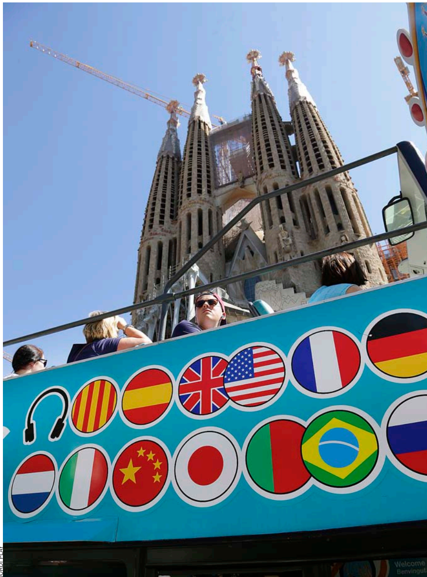
A la Sagrada Família a penes s'hi poden trobar veïns que gaudeixin del temple.

Els veïns de les zones més turístiques de Barcelona han de conviure diàriament amb les aglomeracions i pateixen més que ningú la transformació que viu la ciutat. El turisme porta molts diners, però també incomoditat, i es pot endur una imatge distorsionada de Catalunya.