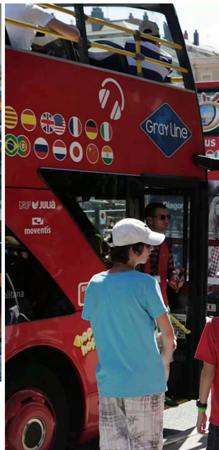
Les aglomeracions de turistes als punts més coneguts de Barcelona dificulten molt la vida quotidiana dels barcelonins. La gent que fa vacances va a la seva sense tenir gaire en compte els veïns.