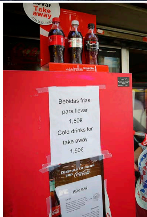
La turistització ha provocat que es creïn “espais tematitzats de consum fàcil”, segons Cé-