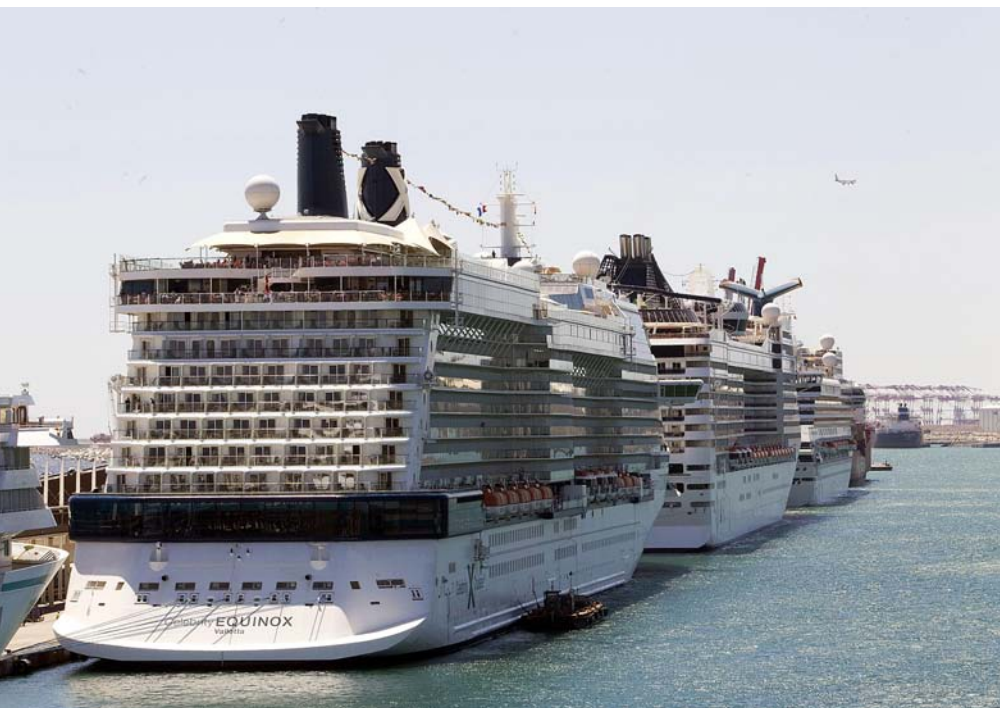
El 18 de maig Barcelona va batre el rècord de creueristes amb 31.000. A la imatge, tres dels quinze creuers que van arribar al port de Barcelona entre el 9 i l'11 d'agost del 2013.

és molt més”, feta en col·laboració amb la Diputació i que té per objectiu convertir Barcelona en una porta d'entrada a les comarques.