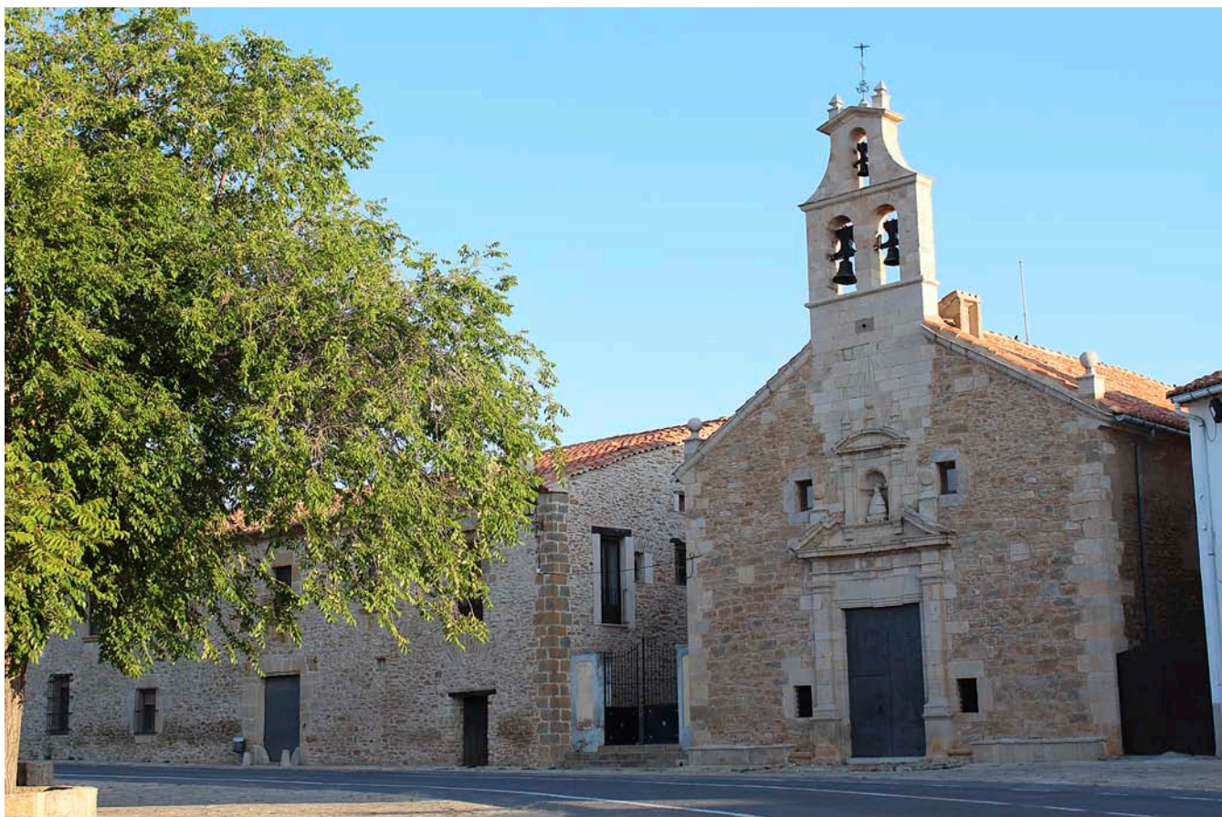
L'ermita de la Verge del Llosar, patrona de Vilafranca, a només 300 metres del Castillo de Roissy.