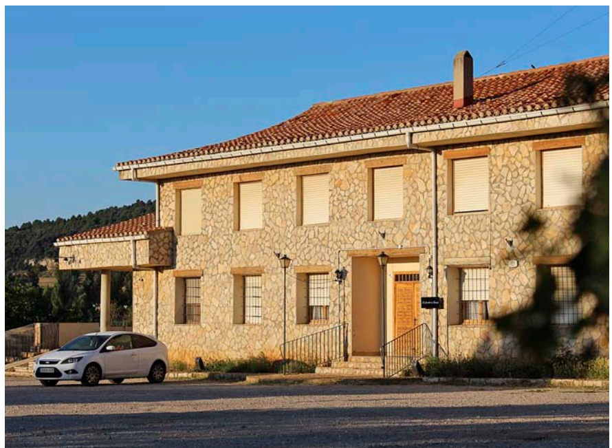
L'antic Hotel L'Om, a Vilafranca, ha esdevingut el Castillo de Roissy.

Una iniciativa promiscua. Qualsevol que s'apropi al Castillo de Roissy no hi detectarà res estrany. Es tracta d'un edifici de dues plantes amb teulat de doble vessant i parets de lloses. Al