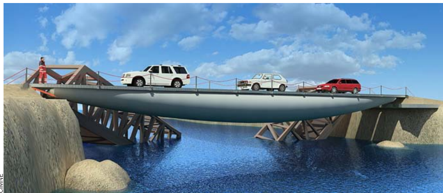
El projecte de pont inflable desenvolupat per l'empresa BuildAir, una spin-off de CIMNE Tecnologia.

repetim, es fa a través dels anomenats mètodes numèrics . Doncs bé, resulta que a Barcelona hi ha un dels centres més importants del món en el desenvolupament d'aquests "sistemes de traducció", el Centre Internacional de Mètodes Numèrics en Enginyeria (CIMNE), creat l'any 1987 per la Generalitat i per la Universitat Politècnica de Catalunya. El CIMNE fa recerca en moltes disciplines de la ciència computacional i crea els programaris necessaris perquè amb un ordinador es modelin i recreïn els fenòmens propis de moltes branques de la ciència. Hi ha incomptables centres i empreses que utilitzen la ciència computacional, però no n'hi ha gaires que desenvolupin els mètodes numèrics que requereix. Fa dues setmanes, el CIMNE va organitzar a Barcelona l'onzena edició del World Congrès of Computational Mechanics, al qual van assistir 4.000 experts de 52 països per presentar els seus avenços.