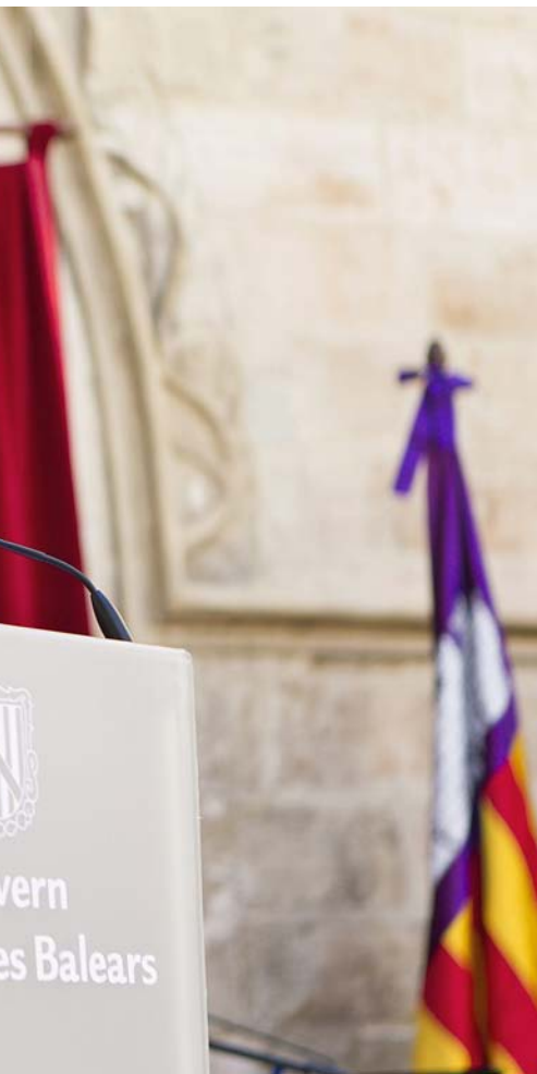
l'elecció de la futura alcaldessa.

almenys la meitat i habitualment la majoria. En aquesta legislatura és quan més diferència ha assolit: el 2011 n'obtingué 8 per només 4 el PSOE-Pacte.