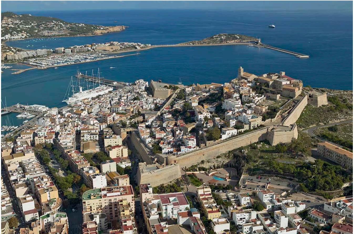
L'Ajuntament de Vila d'Eivissa viu una situació límit a causa de les bregues internes en el PP municipal.